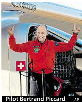
Pilot Bertrand Piccard

Švýcarský letoun na solární pohon Solar Impulse 2 překonal jako první tohoto druhu za zhruba 70 hodin Atlantský oceán a přistál včera ve španělské Seville. Z New Yorku se na 15. etapu cesty kolem světa dlouhou přes 6200 kilometrů vydal v pondělí. Letadlo poháněné výhradně sluneční energií tak dokončilo významnou část obletu Země. V kokpitu se střídají Švýcaři Bertrand Piccard a André Borschberg. ČTK