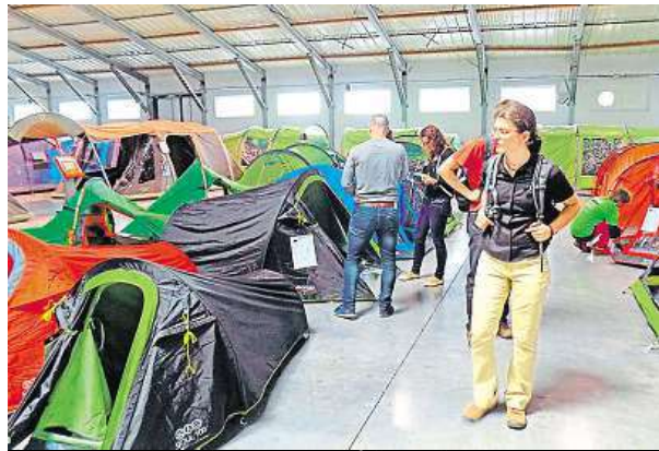
Plocha má více než 10 tisíc metrů čtverečních.