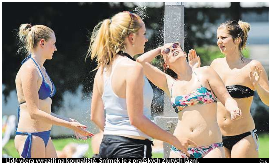
Lidé včera vyrazili na koupaliště. Snímek je z pražských Zlutých lázní.