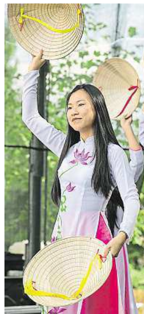
Svou kulturu představí obyvatelé Prahy 9 – cizinci, kteří u nás našli nový domov.