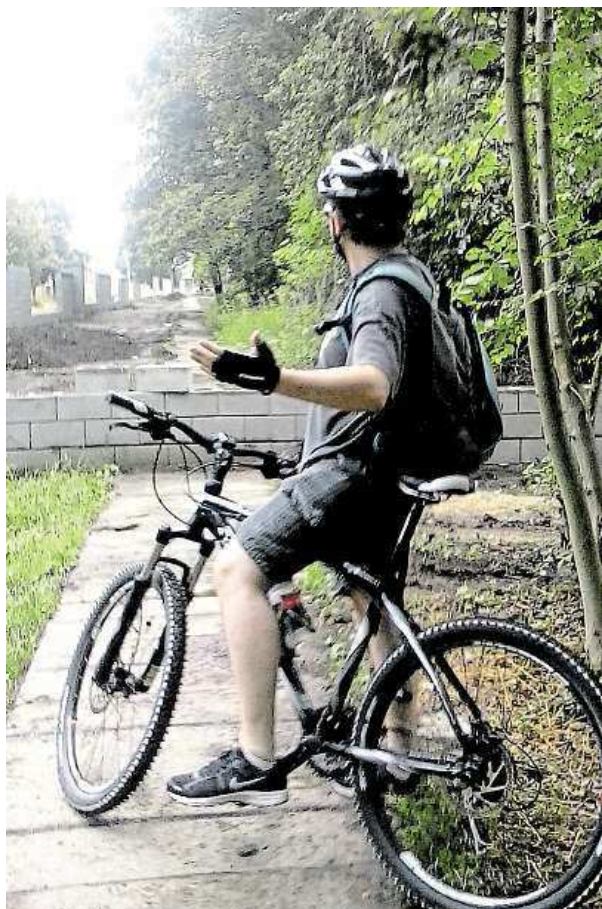
Neuhnete-li z Mladoboleslavské, zaskočí vás plot. METRO

„Důležité je nabídnout lidem kvalitní infrastrukturu. Pokud postavíte kvalitní silnici, řidiči ji začnou používat, totéž platí i pro cyklostezky,“ uzavírá Radek Čermák. BEI