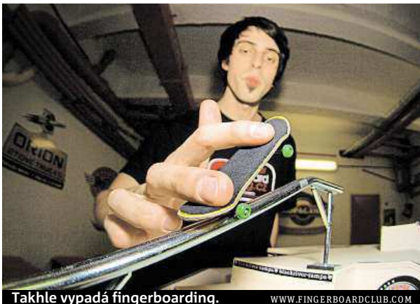
Takhle vypadá fingerboarding.

Možná by se zdálo, že si z fingerboardistů dělají skateboardisté legraci. Je to ale omyl. Na prkně s prsty totiž mnohdy jezdí i skejťáci, aby si bez zranění zkoušeli triky, které pak zkusí venku. Fin-