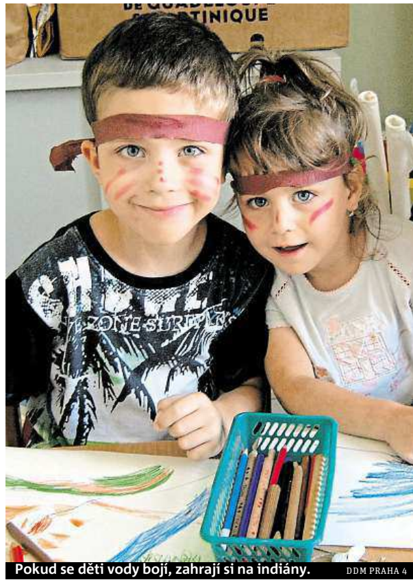
Pokud se děti vody bojí, zahrají si na indiány.