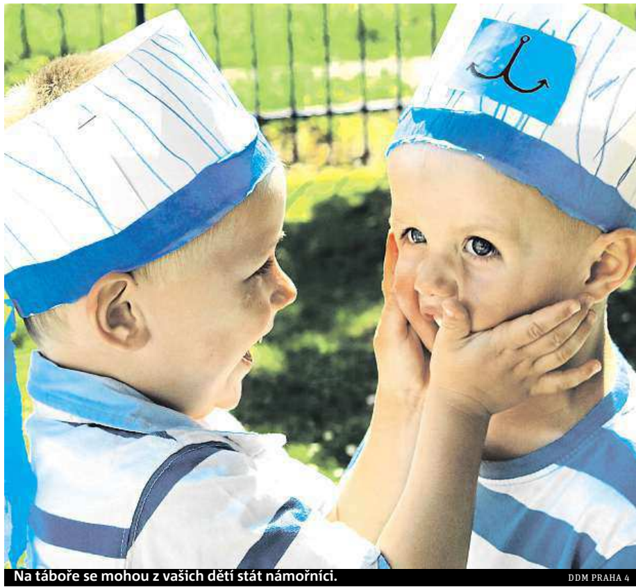
Na táboře se mohou z vašich dětí stát námořníci.