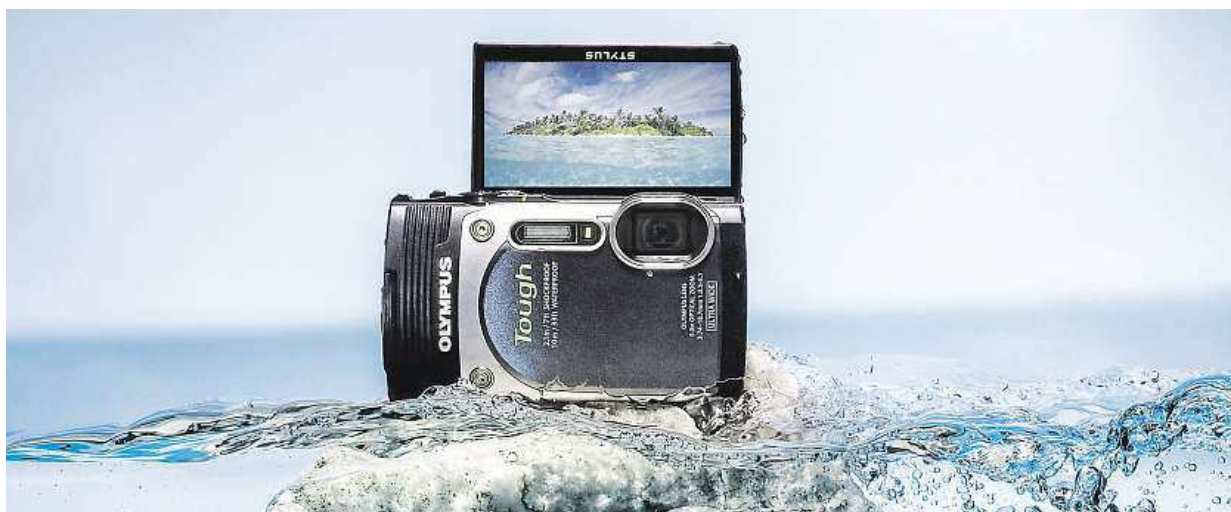
Olympus Touch TG-850 vás překvapí svou praktičností i užitečností.

A materiály? U „vodních“ fotoaparátů se často používá plast, protože neklouže. Olympus je ale z kovu, díky čemuž vydrží i hrubé zacházení, a jistý úchop si jen jistí masivním poutkem.