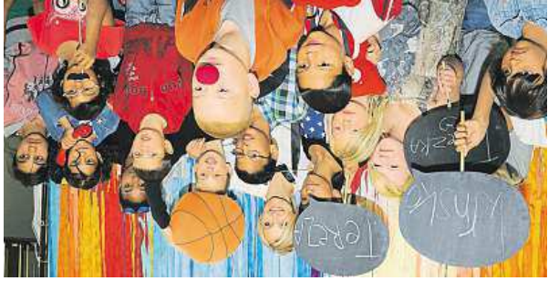
TEREZA MAXOVÁ s dětmi z Krnsku v Národním technickém muzeu, kde si společně užívají zábavně odpovídání na Den dětí

Modelka Tereza Maxová se prostřednictvím své nadace již řadu let věnuje dětem z dětských domovů. Společně se Škoda Auto pro ně připravila vzdělávací projekt Rozjeddu Toi, který dětem pomůže najít v životě lepší uplatnění.