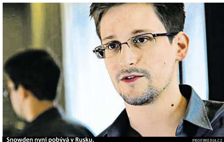
Snowden nyní pobývá v Rusku.

Bývalý spolupracovník amerických tajných služeb Edward Snowden by měl mít možnost vrátit se do USA a hájit se před soudem. Má prokázat, že jednal ve veřejném zájmu, když předloni zveřejnil množství tajných informací o sledování komunikace americkými tajnými službami. Ve svém usnesení k tomu vyzvalo Parlamentní shromáždění Rady Evropy.