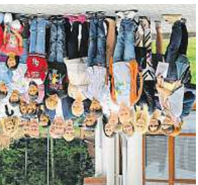
DĚTI Z DĚTSKÉHO DOMOVA v Krnsku snad budou díky programu Rozjeddu Toi v životě úspěšnější