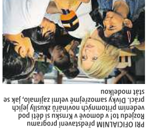
PříčlALINIM představení program Rozjeddu Toi v domově v Krnsku síděl pod vedením přitomých novinarů zkusily jejich stát modelkou