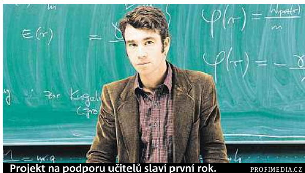
Projekt na podporu učitelů slaví první rok.

Běžně se učitelé se zkušenějšími kolegy radí o konkrétních situacích a administrativních záležitostech. Mentoring se vedle toho systematicky za-