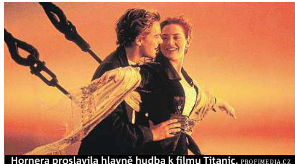
Hornera proslavila hlavně hudba k filmu Titanic.