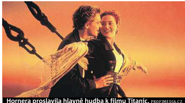
Hornera proslavila hlavně hudba k filmu Titanic.