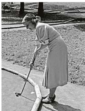
Černobílý snímek ze 30. let 20. století zachycuje minigolfové radovánky v Německu.