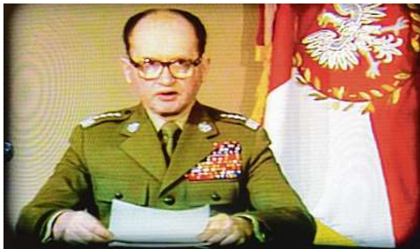
Píše se 13. prosinec 1981. Wojciech Jaruzelski vyhláší válečný stav. Ten potrvá až do léta 1983. Odpůrci končí v internačních táborech.

S osudy Wojciecha Jaruzelského radikálně zamíchal rok 1939 a Hitlerův útok na Polsko. Po obsazení země odešla rodina Jaruzelských do Litvy, kde ji zadržely sovětské úřady a deportovaly hlu-