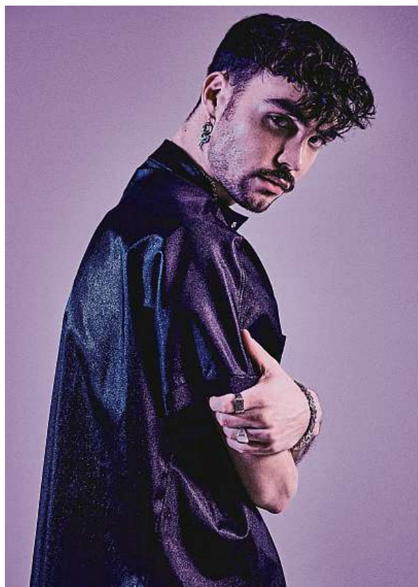
V roce 2021 se stal vítězem SuperStar a hned o rok později se dostal do seznamu magazínu Forbes 30 pod 30. TOMAS THURZO

Je to pro mě určitě změna, ale velmi příjemná. Mám pocit, že je tu pořád co nového objevovat a je to pro mě jako čerstvě vymalované hřiště, kde si můžu všechno vyzkoušet. S texty ve slovenštině jsem neměl žádné zkušenosti, takže jsem si na prvních slovenských písních dal opravdu záležet. Opravdu mě to chytlo a plánuji celé album ve slovenštině. Mám pocit, že se tak můžu ještě víc přiblížit svým fanouškům. Je to trochu jiná poloha, víc nahá.