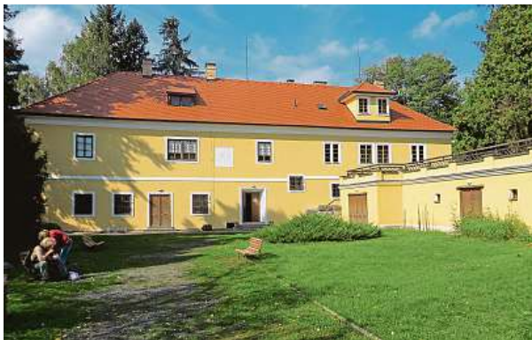
Myslivna v Jabkenicích. Jedno z mnoha míst v Česku, kde Bedřich Smetana pobýval a věnoval se hudební tvorbě.