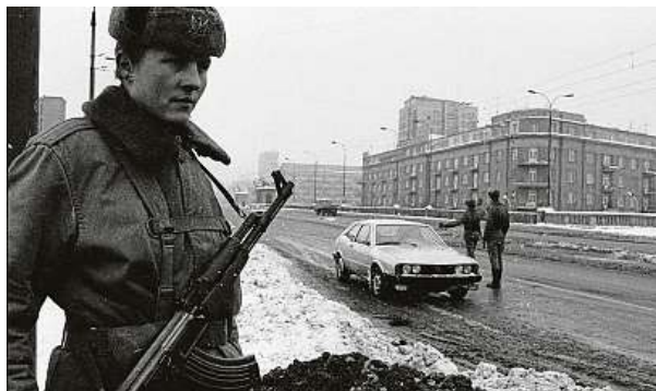
Hned po půlnoci 13. prosince zahájily pohotovostní oddíly policie zatýkání podle připravených seznamů 13 tisíc činitelů opozice.

jmenovali předsedou vlády a v říjnu zasedl v samotném čele PSDS, přičemž nadále zůstal i ministrem obrany. Stal se tak nejmočnějším mužem v zemi a v noci z 12. na 13. prosince 1981 nechal vyhlásit v Polsku výjimečný stav – tento pojem však v tehdejších polských zákonech neexistoval, takže Jaruzelski fakticky vyhlásil válečný stav. Moc převzala jím vedená Vojenská rada národní záchrany, která během následujícího roku a půl zatlačila opo-