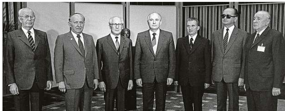
Rok 1988. Setkání vedoucích představitelů socialistických zemí. W. Jaruzelski pózuje druhý zprava, uprostřed stojí sovětský lídr Michail Gorbačov. Zcela vlevo je Gustáv Husák, prezident ČSSR.

Vyhlášení výjimečného stavu Jaruzelski obhajoval do konce života. Podle něj představovalo menší zlo nastolit pořádek vlastními silami než riskovat ruskou intervencí. Za násilnosti se několikrát omluvil a ve své autobiografii nazvané O 30 let starší v této souvislosti poznamenal, že