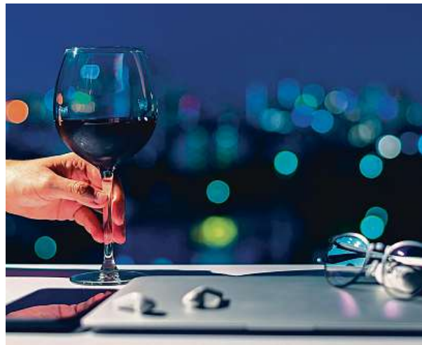
Seznamovací aplikace jsou většinou založeny na párování na základě vzhledu. Mladí proto dávají přednost seznámení naživo.

Podle psycholožky z on-line poradny Mojra.cz Venduly Šild Vojtové mohou samozřejmě sociální sítě dost uškodit. „Pro navázání dlouhodobého úspěšného vztahu je vzhled oproti povaze či hodnotám takřka nedůležitý. Seznamovací aplikace jsou ale většinou založeny na párování právě na základě vzhledu. Lidé mnohdy na svých profilech neříkají úplnou pravdu, zamlčují své záměry či tam zveřejňují nepřesné fotografie,“ vysvětluje a dodává, že přes seznamovací aplikace ztrácíme možnost si člověka obvykle prohlédnout a zjistit, jestli nám je sám o sobě sympatický. „Realitu pak často zjišťujeme až na domluveném rande. Když pak člověk absolvuje velké množství ta-