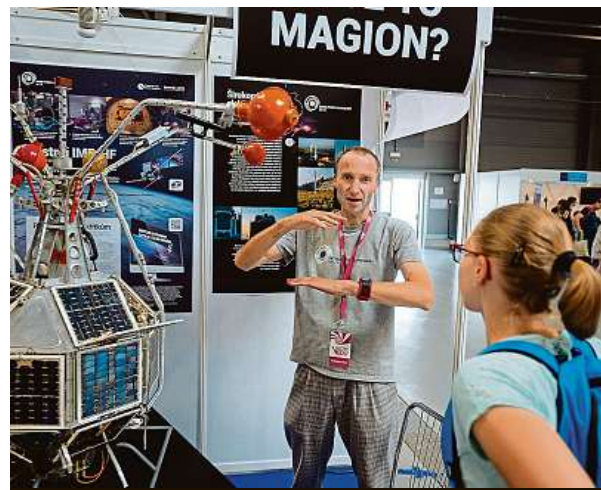
Veletrh bude otevřen vždy od 10 do 18 hodin.

„Návštěvníci si tak zažijí, jaké to je být v kůži a čase profesora Otty Wichterleho, a budou mít možnost vyrobit si silikonky, jak se to před více než padesáti lety podařilo právě jemu, a také zjistí, jak funguje chytrá domácnost, jak se upravuje pitná voda nebo