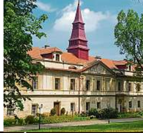
Památky, které nejspíš neznáte (zleva): zámky Blatná, Castolovice a Uhohličky.