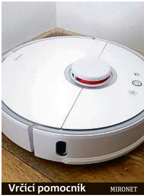
Vrčící pomocník MIRONET

Pro zachování čisté domácnosti je pravidelné vysávání základ. Dnes už ale s touto nepříjemnou činností nejste odkázáni jen na vlastní ruce.