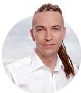
IVAN BARTOŠ PŘEDSEDA ČESKÉ PIRÁTSKÉ STRANY

DNES (PÁ) — 14:00–22:00 | ZÍTRA (SO) — 8:00–14:00