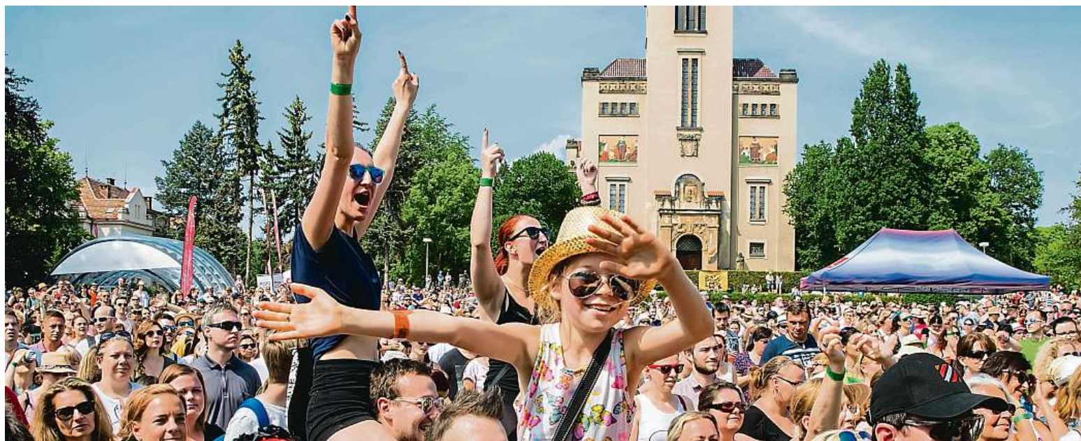
Festival Mezi ploty získal uznání v podobě prestižního označení EFFE Label 2017/2018. EFFE je iniciativa Evropské festivalové asociace.