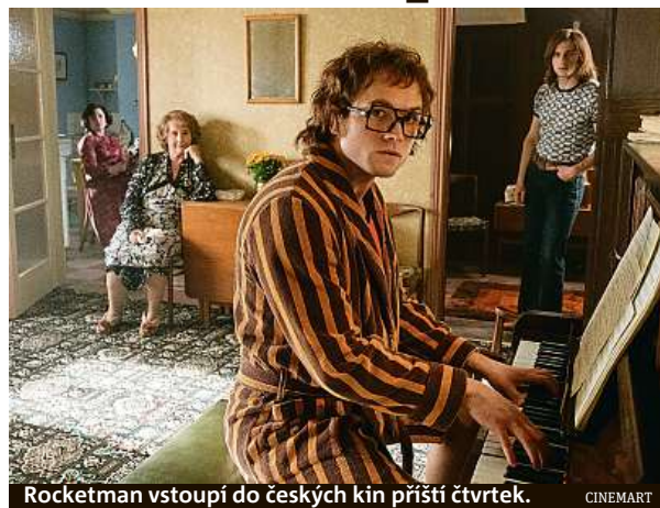
Rocketman vstoupí do českých kin příští čtvrtek. CINEMART

Snímek Rocketman, pojmenovaný po jednom z Eltonových hitů, je možné brát různě. Já jsem se na jeho projekci vypravil poměrně nezátčen předstudies nebo chutí srovnávat s jinými životopisnými filmy. Musím však přiznat, že jsem se z dvouhodinové stopá-