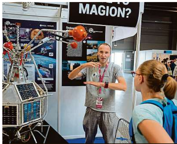
Veletrh bude otevřen vždy od 10 do 18 hodin.

„Návštěvníci si tak zažijí, jaké to je být v kůži a čase profesora Otty Wichterleho, a budou mít možnost vyrobit si silikonky, jak se to před více než padesáti lety podařilo právě jemu, a také zjistí, jak funguje chytrá domácnost, jak se upravuje pitná voda nebo