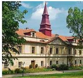
Památky, které nejspíš neznáte (zleva): zámky Blatná, Castolovice a Uhončovice.