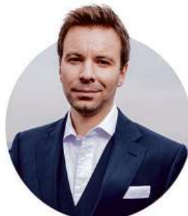
MARCEL KOLAJA LÍDR PIRÁTŮ DO EUROVOLEB

„V těchto volbách se rozhoduje o budoucnosti Evropské unie. Piráti jsou jasná volba pro svobodomyšlné lidi, kteří chtějí Evropu, která obstojí ve třetím tisíciletí. Přijďte prosím dnes nebo zítra k volbám a pomozte Pirátům vyhrát.“