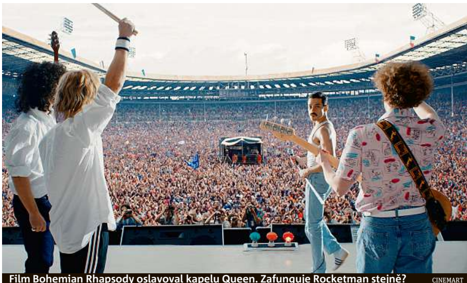
Film Bohemian Rhapsody oslavoval kapelu Queen. Zafunguje Rocketman stejně?

„Jak možná víte, Bohemian Rhapsody nedal ve finále dohromady režisér Bryan Singer, nýbrž Dexter Fletcher, režisér skvělého Orla Eddieho. Studio Fox mu film svěřilo i proto, že právě chystal po-