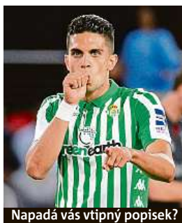
Napadá vás vtipný popisec?

Napište bublinu a reagujte na sloupek na: www.facebook.com/denikmetro