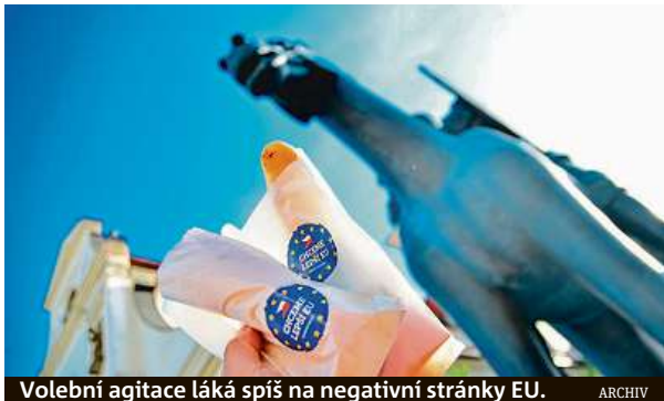
Volební agitace láká spíš na negativní stránky EU.

Nikdo nebilancoval svoje výsledky, nebo jen okrajově. Všichni zřejmě vsadili na to, že voliči jim hlas dají. Kampaně jsou vesměs fádny. Časově se omezily na jeden měsíc. Postrádal jsem aktivní touhu voliče opravdu oslovit. Nevím, jak je osloví čepice nebo ese-