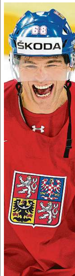
Jaromír Jágr

Na českém území se světový šampionát dosud konal desetkrát.