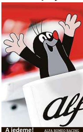
A jedeme! ALFA ROMEO RACING

Slavná pohádková postava Krtečka se vydává do světa formule 1. Hrdina animovaných filmů a knížek pro děti se v minulosti podíval do vesmíru na palubě raketoplánu, teď se představuje v královské disciplíně motorsportu. Jeho obrazy teď nově zdobí monoposty týmu Alfa Romeo.