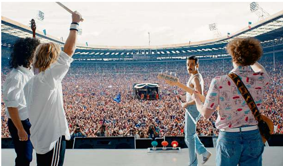
Film Bohemian Rhapsody oslavoval kapelu Queen. Zafunguje Rocketman stejně?

„Jak možná víte, Bohemian Rhapsody nedal ve finále dohromady režisér Bryan Singer, nýbrž Dexter Fletcher, režisér skvělého Orla Eddieho. Studio Fox mu film svěřilo i proto, že právě chystal po-