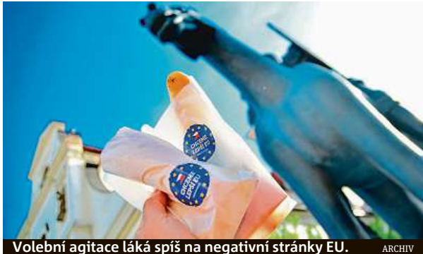
Volební agitace láká spíš na negativní stránky EU.

Nikdo nebilancoval svoje výsledky, nebo jen okrajově. Všichni zřejmě vsadili na to, že voliči jim hlas dají. Kampaň jsou vesměs fádni. Časově se omezily na jeden měsíc. Postrádal jsem aktivní touhu voliče opravdu oslovit. Nevím, jak je osloví čepice nebo ese-