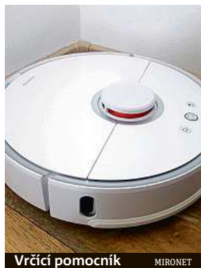
Vrčící pomocník MIRONET

Pro zachování čisté domácnosti je pravidelné vysávání základ. Dnes už ale s touto nepříjemnou činností nejste odkázáni jen na vlastní ruce.