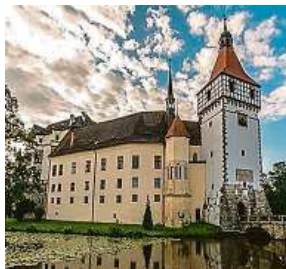
Památky, které nejspíš neznáte (zleva): zámky Blatná, Častolovice a Úholičky.