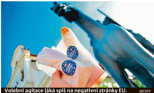
Volební agitace láká spíš na negativní stránky EU. ARCHIV

Nikdo nebilancoval svoje výsledky, nebo jen okrajově. Všichni zřejmě vsadili na to, že voliči jim hlas dají. Kampaně jsou vesměs fádny. Časově se omezily na jeden měsíc. Postrádal jsem aktivní touhu voliče opravdu oslovit. Nevím, jak je osloví čepice nebo ese-