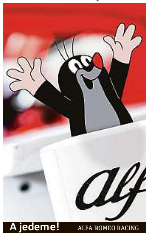
A jedeme! ALFA ROMEO RACING

Slavná pohádková postava Krtečka se vydává do světa formule 1. Hrdina animovaných filmů a knížek pro děti se v minulosti podíval do vesmíru na palubě raketoplánu, teď se představuje v královské disciplíně motorsportu. Jeho obrazek totiž nově zdobí monoposty týmu Alfa Romeo.