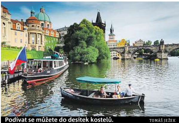
Podívat se můžete do desítek kostelů.