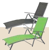
Lehátko, ALU konstrukce / látka černá, šedá, limetka, 64 x 81 x 138 cm, 4575248-00, 02, 03