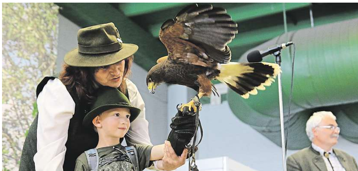
V Lysé nad Labem se koná 23. ročník mezinárodní výstavy myslivosti, rybářství, včelařství a pobytu v přírodě Natura Viva 2018.

GDPR. Nařízení na ochranu dat a osobních údajů startuje už zítra. Cíl. Ochrana práv občanů Evropské unie a osob pohybujících se v rámci hranic EU. Týká se. Firem i jednotlivců, kteří pracují s osobními údaji STRANY 8 A 10