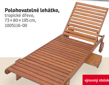
Polohovatelné lehátko, tropické dřevo, 73 x 80 x 195 cm, 1005116-00