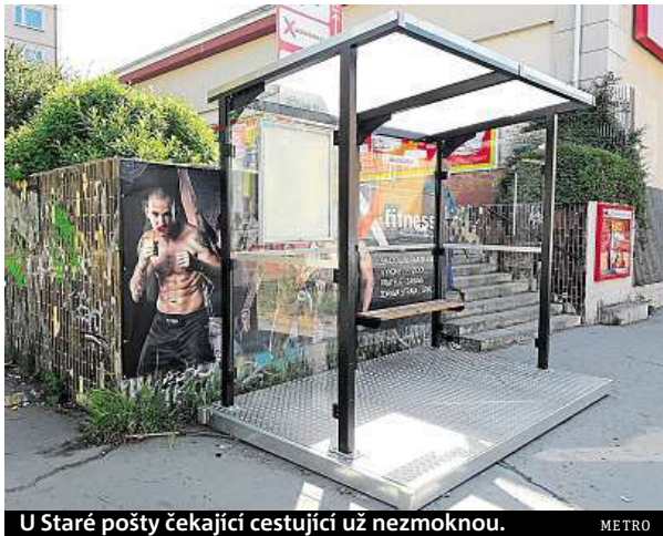
U Staré pošty čekající cestující už nezmoknou.

Na branické zastávce U Staré pošty stojí už pár dní nový přístřešek. Je to jeden z padesáti exemplářů, které dopravní podnik v těchto dnech rozmisťuje po metropoli. Dopravce se rozhodl vyslyšet žádosti městských částí a rozmisťuje přístřešky k zastávkám, kde dosud žádné nebyly. Například v Praze 4 budou tři nové prosklené budky. „Chceme, aby lidé na zastávkách MHD, kde v minulosti z nějakého důvodu nebyl umístěn přístřešek, nemokli. Takže jsme ve třech případech požádali dopravní podnik, aby sem umístil aspoň