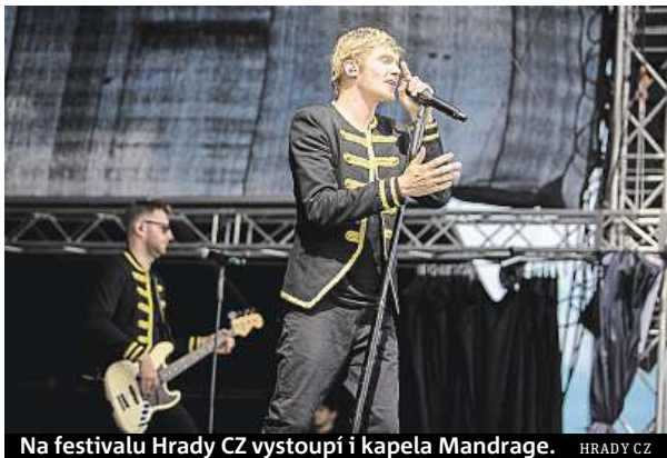
Na festivalu Hrady CZ vystoupí i kapela Mandrage. HRADY CZ

Čtrnáctému ročníku putovního festivalu budou v prostředí památek dominovat Divokej Bill, Tomáš Klus, Mandrage a nově Lenny, Jelen či Slza.