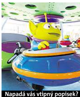
Napadá vás vtipný popisek?

Napište bublinu a reagujte na sloupek na: www.facebook.com/denikmetro