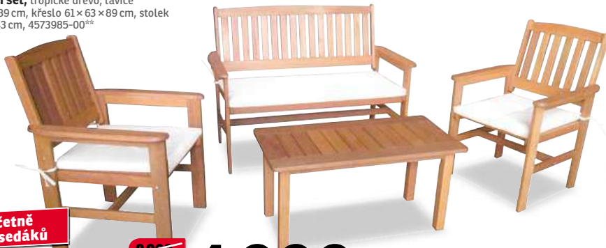
Zahradní set, tropické dřevo, lavice 120 x 63 x 89 cm, křeslo 61 x 63 x 89 cm, stůlek 90 x 45 x 43 cm, 4573985-00**