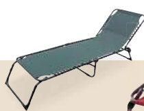
Lehátko, kovová konstrukce, látka červená nebo zelená, 59 x 26 x 190 cm, 1003252-00, 01