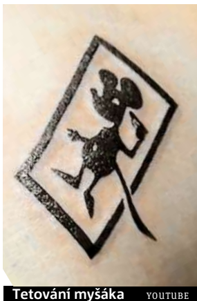
Tetování myšáka YOUTUBE

Není to v Česku poprvé, kdy firma nabízí bonus za vytetování svého loga, v tomto případě jde o myšáka.