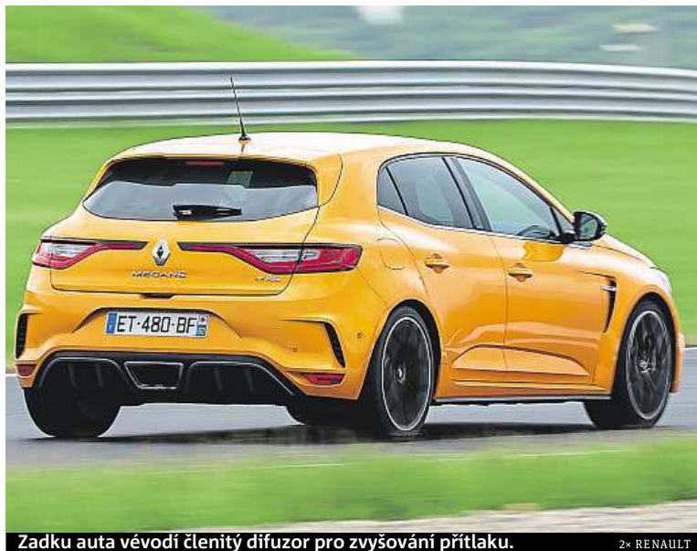
Zadku auta vévodí členitý difuzor pro zvyšování přtlaku.