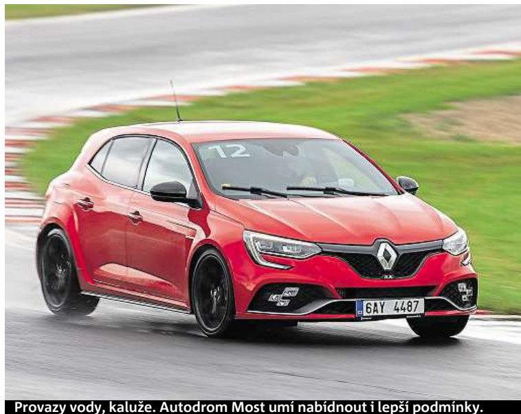
Provoz vody, kaluže. Autodrom Most umí nabídnout i lepší podmínky.