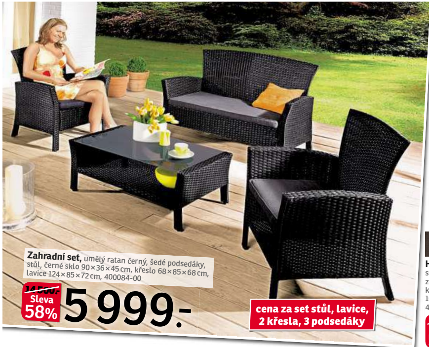
Zahradní set, umělý ratan černý, šedé podsedáky, stůl, černé sklo 90 x 36 x 45 cm, křeslo 68 x 85 x 68 cm, lavice 124 x 85 x 72 cm, 400084-00