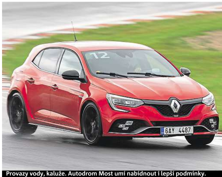
Provoz vody, kaluže. Autodrom Most umí nabídnout i lepší podmínky.