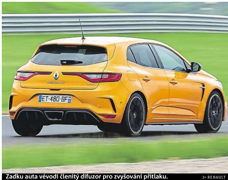
Zadku auta vévodí členitý difuzor pro zvyšování přítlaku.