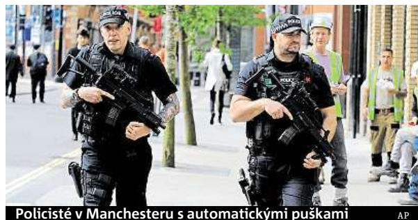
Policisté v Manchesteru s automatickými puškami.