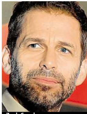
Zack Snyder

Odchod Zacka Snydera není pro Warnery žádnou ma-