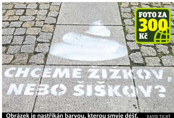
Obrázek je nastříkán barvou, kterou smyje déšť. DAVID TICHÝ

Žižkovské chodníky v posledních dnech ozdobil jednoduchý nastříkaný obrázek psiho exkrementu se vzkazem pro pejskaře: Chceme Žižkov, nebo Šiškov?