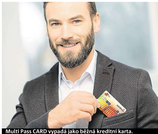
Multi Pass CARD vypadá jako běžná kreditní karta.

Společnost Sodexo Benefit se zaměřila na jednoduchost využívání těchto benefitů a od května zavedla jako první v České republice novou Multi Pass CARD, která slouží zároveň jako bezkontaktní elektronická stravenka i karta na volnočasové benefity. Pohodlně s ní lze zaplatit jak polední menu, tak