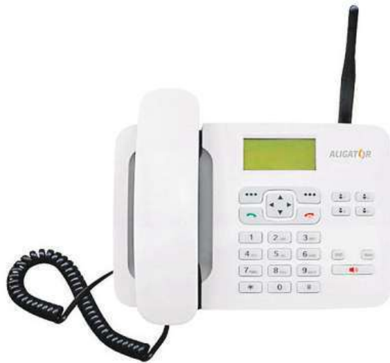
Mobil, který vypadá jako pevná linka.

Pro pohodlnější telefonování disponuje Aligator funkcí hands-free, abyste mohli komunikovat a zároveň mít obě ruce volné třeba pro zapisování svých důležitých poznámek.