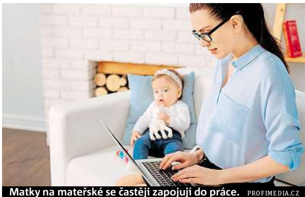
Matky na mateřské se častěji zapojují do práce.

Matkám a otcům na rodičovské dovolené přizpůsobují zaměstnavatelé pracovní dobu, ale také prostředí.