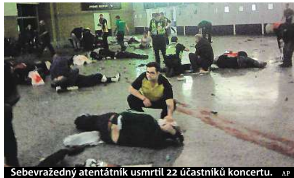
Sebevražedný atentátník usmrtil 22 účastníků koncertu.

Během včerejšího dne britská policie krátce evakuovala velké nákupní středisko Arndale v Manchesteru, kde zadržela jednoho muže. Incident však s atentátem očividně nesouvisel. O něco dříve policisté vyklidili kvůli podezřelému balíčku také autobusové nádraží Victoria v centru hlavního města Londýna. Ukázalo se však, že to byl jen planý poplach. MET, ČTK