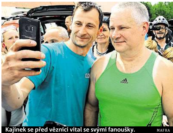
Kajínek se před věznicí vítal se svými fanoušky.

Kajínek si zřejmě nebude užívat jen svobody, ale také peněz. Dokonce se spekuluje o tom, že si během pobytu za mřížemi vydělal až dva miliony. Největší část z této sumy tvoří honoráře za film Kajínek režiséra Petra Jábla.