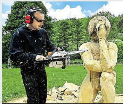
Umělci v Držkové