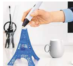
3D pero, které vás pobaví.

Představte si dnes už poměrně běžnou 3D tiskárnu. Její princip spočívá v zadání vstupních dat a pak už jenom čekáte, co na vás tiskárna tak říkajíc vyplivne. Vy teď ale máte možnost stát se díky 3D peru Forever Happy Pen jakousi 3D tiskárnou sami. Pero vám totiž umožní nakreslit libovol-