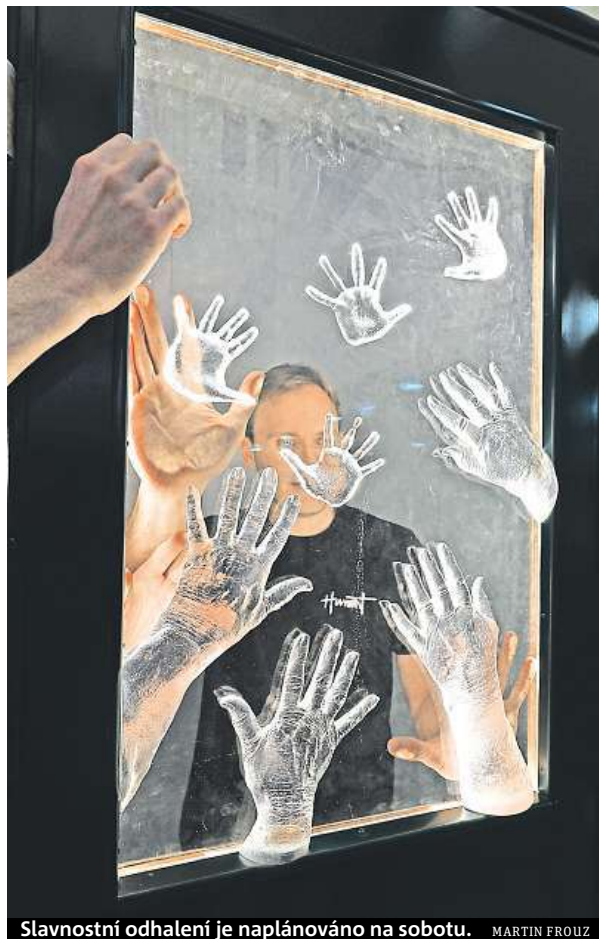
Slavnostní odhalení je naplánováno na sobotu. MARTIN FROUZ