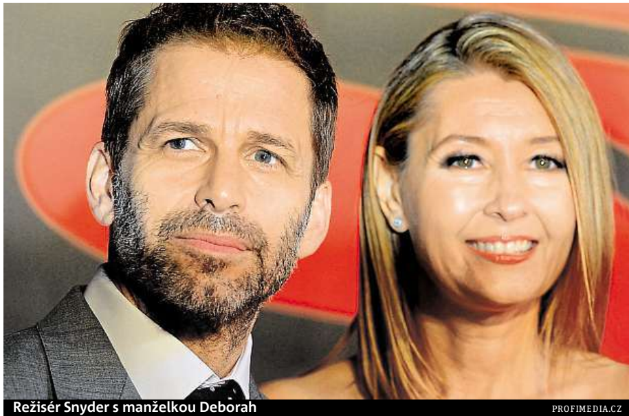
Režisér Snyder s manželkou Deborah

Odchod Zacka Snydera není pro Warnery žádnou maličkostí, ale jde o krok, který může způsobit či naopak zhatit miliardové tržby. Režisér již pro studio natočil snímky 300: Bitva u Thermopyl, Watchmen, Muž z oceli a Batman versus Superman. Studio s ním do budoucna počítalo také jako s režisérem pokračování Ligy spravedlnosti, které na první díl mělo bezprostředně navazovat. „Komiksově filmy od DC se vždy alespoň na oko snažily co nejvíce odlišit od těch Marvelových. Větší zapojení Whedona v dalším pokračování Ligy by znamenalo tuhle image popřít,“ vysvětluje Rozšafný.