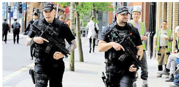
Policisté v Manchesteru s automatickými puškami.