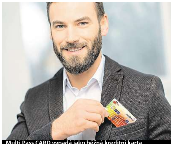
Multi Pass CARD vypadá jako běžná kreditní karta.

Společnost Sodexo Benefits se zaměřila na jednoduchost využívání těchto benefitů a od května zavedla jako první v České republice novou Multi Pass CARD, která slouží zároveň jako bezkontaktní elektronická stravenka i karta na volnočasové benefity. Pohodlně s ní lze zaplatit jak polední menu, tak