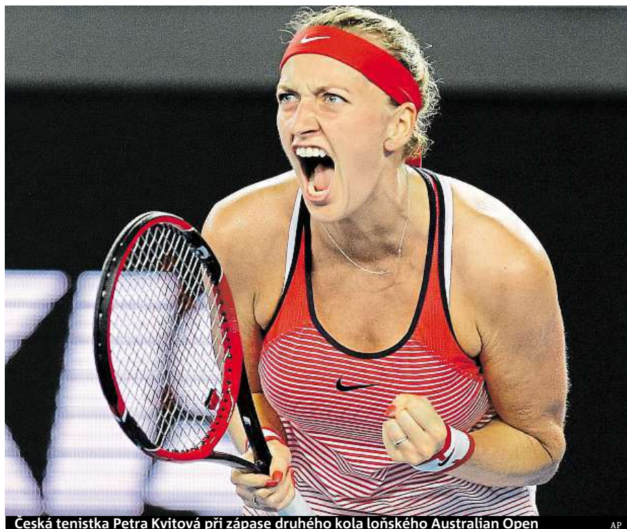
Česká tenistka Petra Kvitová při zápase druhého kola loňského Australian Open

Wimbledon patří mezi nejoblíbenější akce Kvitové. Dnes bude její jméno mezi zveřejněnými účastníky turnaje v All England Clubu, kde třetí grandslam sezony začne 3. července. Pořadatelé by její start přivítali. ČTK