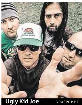
Ugly Kid Joe

Kalifornská kapela odehraje letos jediný koncert v Česku. A to 6. června v pražském