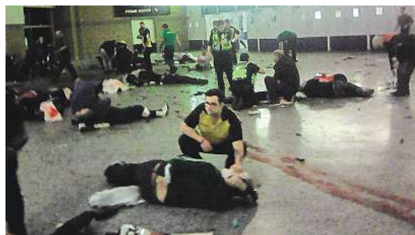
Sebevražedný atentátník usmrtil 22 účastníků koncertu.

Během včerejšího dne britská policie krátce evakuovala velké nákupní středisko Arndale v Manchesteru, kde zadržela jednoho muže. Incident však s atentátem očividně nesouvisel. O něco dříve policisté vyklidili kvůli podezřelému balíčku také autobusové nádraží Victoria v centru hlavního města Londýna. Ukázalo se však, že to byl jen planý poplach. MET, ČTK