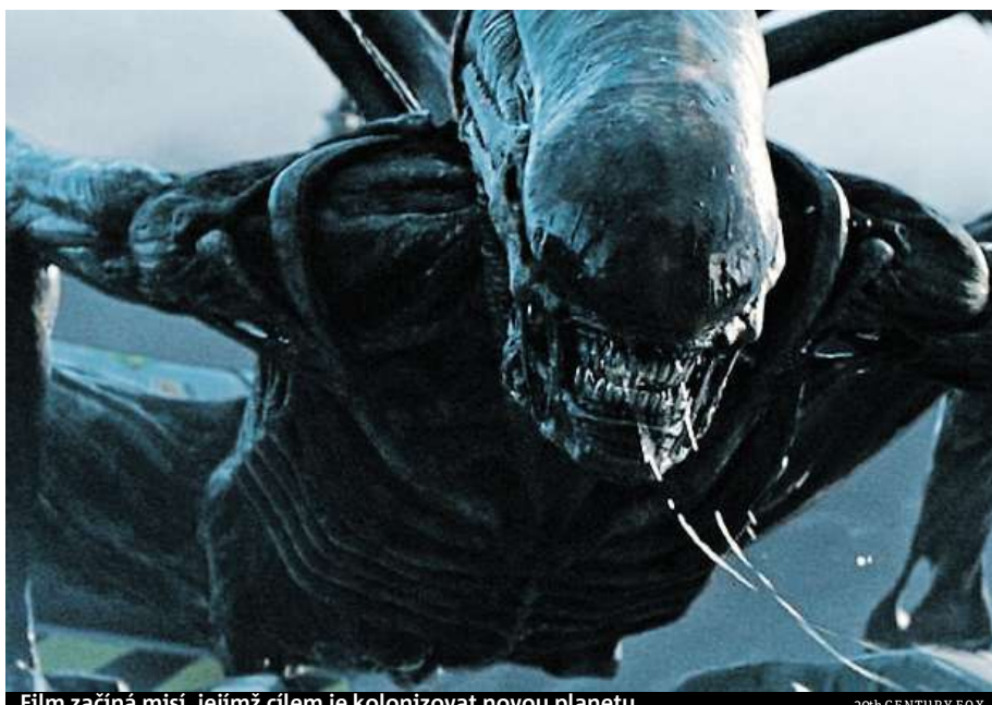
Film začíná misí, jejímž cílem je kolonizovat novou planetu.