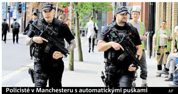
Policisté v Manchesteru s automatickými puškami