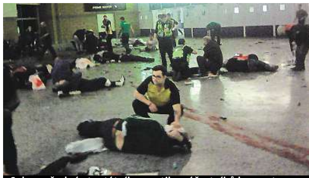
Sebevražedný atentátník usmrtil 22 účastníků koncertu.

Během včerejšího dne britská policie krátce evakuovala velké nákupní středisko Arndale v Manchesteru, kde zadržela jednoho muže. Incident však s atentátem očividně nesouvisel. O něco dříve policisté vyklidili kvůli podezřelému balíčku také autobusové nádraží Victoria v centru hlavního města Londýna. Ukázalo se však, že to byl jen planý poplach. MET, ČTK