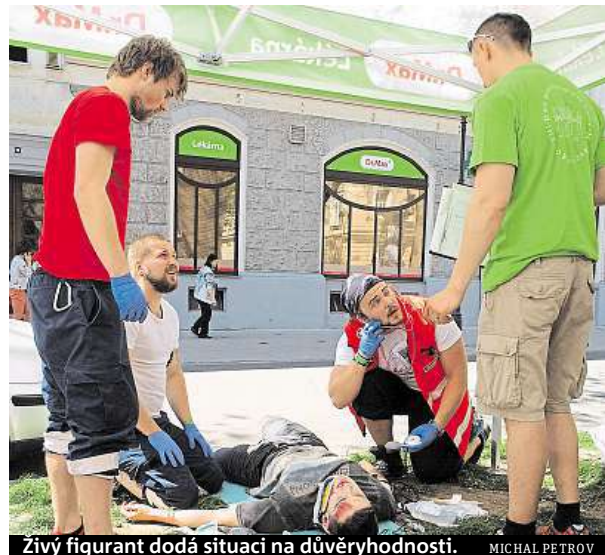
Živý figurant dodá situaci na důvěryhodnosti.