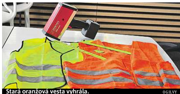
Stará oranžová vesta vyhrála.