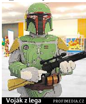
Voják z lega

Agresivita není v současné době v rámci zábavy pro děti jen záležitostí počítačových her. Vědci ve výzkumu uveřejněném v digitálním magazínu PLOS ONE uvádějí, že i produkty Lega se stávají výrazně násilnějšími. Důvodem je právě to, že musí o pozornost dětí v éře digitální zábavy soupeřit. „Produkty Lega nejsou tak nevinné, jak by měly být,“ uvádí jeden z autorů výzkumu Christoph Bartneck. Studie podrobně analyzuje produkty Lega už od zahájení výroby legendárních kostek v roce 1949. První zbraň se však ve stavebnicích objevila až o 29 let později. Součástí setu středověkého hradu tehdy byly meče, sekery