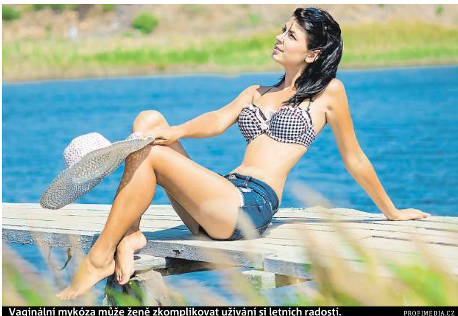
Vaginální mykóza může ženě zkomplikovat užívání si letních radostí.

Příznakem mykózy je výtok, otok či zarudnutí postiženého místa a především nepříjemný svědivý pocit. Je úporný a asi nejvíce jej ženy pocítí v kľidu a v teple. Svědění ale může ukazovat i na jiný problém, a tím je bakteriální vaginóza. V lékárnách je