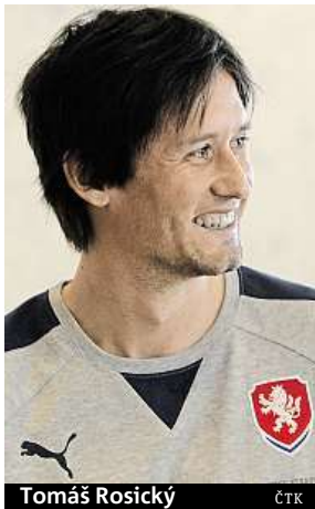
Tomáš Rosický

Naopak nechyběl uzdravený kapitán Tomáš Rosický,