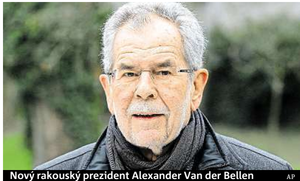
Nový rakouský prezident Alexander Van der Bellen

Velmi vyrovnaný boj o prezidentské křeslo rozhodly až korespondenční hlasy.