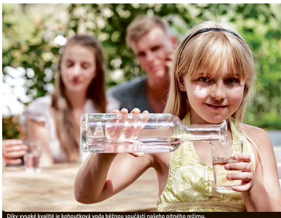
Díky vysoké kvalitě je kohoutková voda běžnou součástí našeho pitného režimu.

Jaká je ale kvalita kohoutkové vody u vás doma? Získat tyto informace je dnes díky internetové aplikaci snadné. Stačí navštívit webové stránky Pražských vodovodů a kanalizací www.pvk.cz a na hlavní stránce zvolit aplikaci Mapa kvality vody. Po zadání adresy vašeho domu se vám po