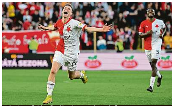
Slavia vstřelila tři góly už v prvním poločase. ČTK