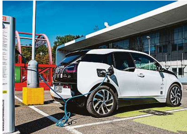
U elektrojetiny nižší kapacita baterie nemusí vadit.

„Áčka“ se ale současně snaží nástup elektromobility zachytit, například důkladnou revizí původu a servisní historie elektrovozidel, včetně