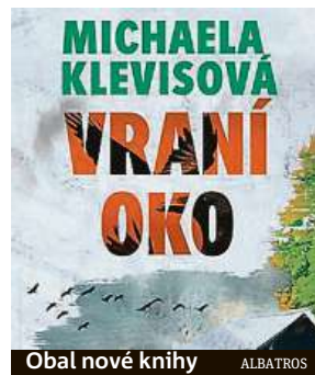
Obal nové knihy

„Detektivka v mém podání je příběh, o kterém bude čtenář přemýšlet, ale nebude mít zlé sny. Ten žánr jsem si vybrala, protože jsem ho hodně četla, ale jen britskou detektivku, ve které jde o spleť příběhů a není jen o násilí a krutosti,“ řekla Klevisová deníku Metro.