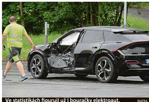
Ve statistikách figurují už i bouráčky elektroaut.

Jako rapidně rostoucí segment trhu hodnotí elektrická vozidla i další velký prodejce, Auto ESA. „Elektroauta stále