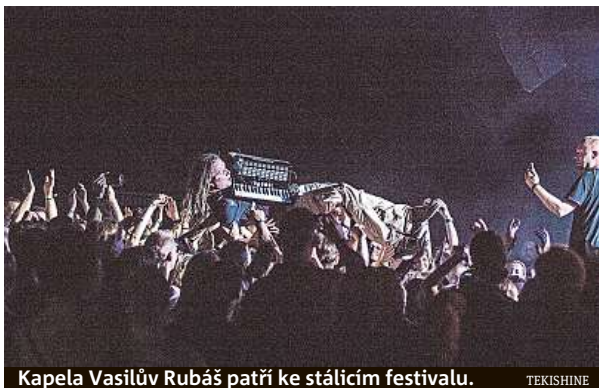
Kapela Vasilův Rubáš patří ke stálícím festivalu. TEKISHINE

Mezi vystupujícími nebudou letos od 15. do 20. srpna chybět festivalové stálice jako kapely Vasilův Rubáš, Terne Čhave či Fredy&Krusty.