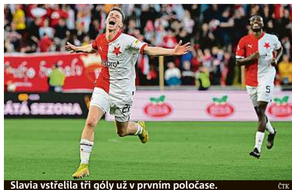
Slavia vstřelila tři góly už v prvním poločase.