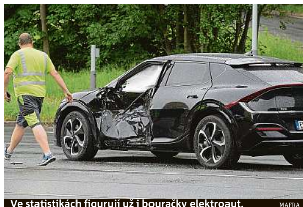
Ve statistikách figurují už i bouráčky elektroaut.

Výraznějšímu prodeji elektromobilů pomohlo několikeré snížení cen vozů Tesla v posledních měsících. V bazarech se ale ceny menších vozů drží na půl milionu korun, těch větších a luxusnějších na milionu. PAVEL HRABICA