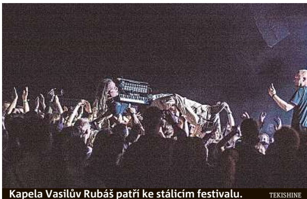
Kapela Vasilův Rubáš patří ke stálícím festivalu. TEKISHINE

Mezi vystupujícími nebudou letos od 15. do 20. srpna chybět festivalové stálice jako kapely Vasilův Rubáš, Terne Čhave či Fredy&Krusty.