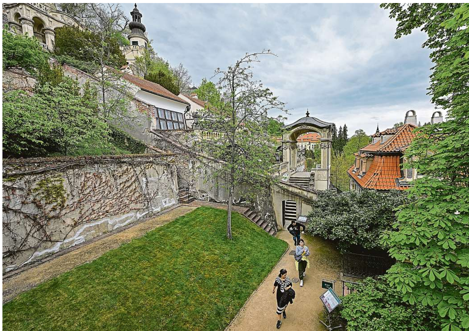
V rámci oslav 20 let Národního památkového ústavu se včera otevřely Zahrady pod Pražským hradem. Na snímku je Kolowratská zahrada.

Elektroauta. Jejich počet přibývá, do Česka se více dovážejí individuálně. Názor. Pohon aut na baterky je cesta do pekel, říká šéf společnosti zabývající se historií ojetin. Velké riziko. Když se poškodí baterie STRANA 4