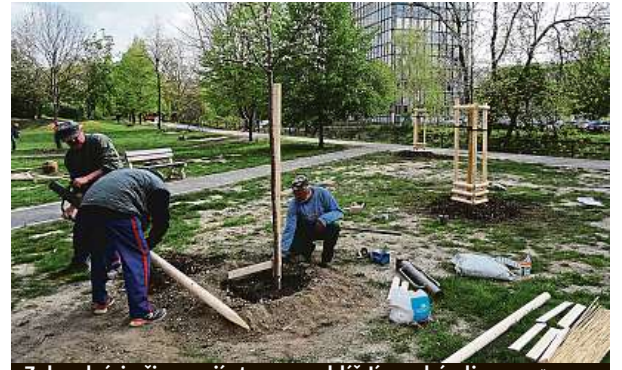
Zahradníci připravují stromy poblíž Jivenské ulice. 2x MČ Praha 4