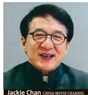
Jackie Chan CHINA MOVIE CHANNEL

Festival Týden čínského filmu startuje právě dnes.