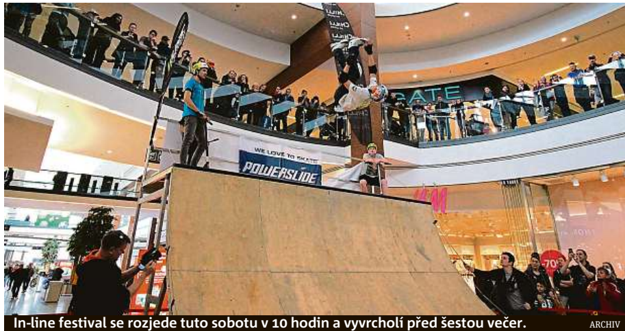
In-line festival se rozjede tuto sobotu v 10 hodin a vyvrcholí před šestou večer.

Lákadlem pro veřejnost je především exhibice profesionálních jezdců na U-rampě a Street zóně na aggressive bruslích. Svou účast přislíbili také profesionální