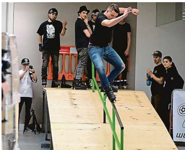
Pochoutka pro odvážlivce