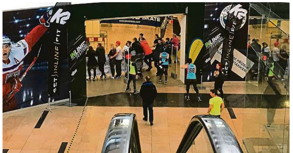
Adrenalin na kolečkových bruslích