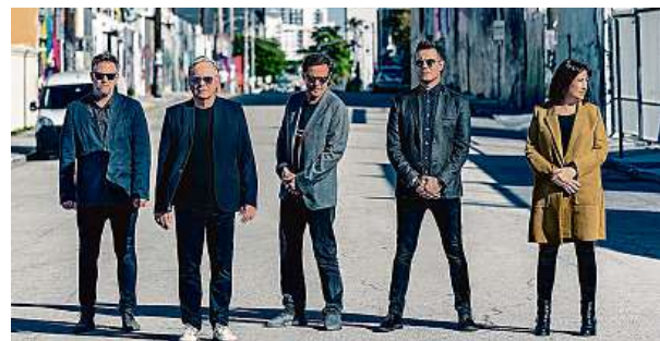
Britská postpunková formace