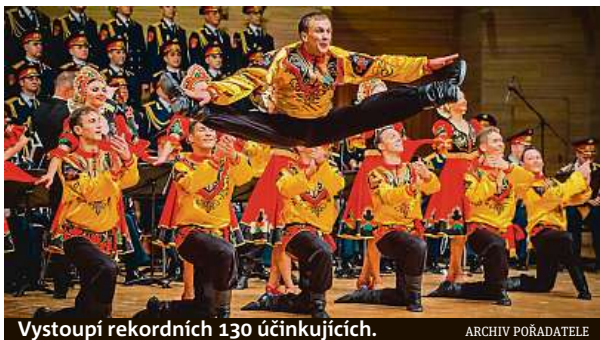
Vystoupí rekordních 130 účinkujících.

Ruský soubor Alexandrovci slaví letos kulaté 90. výročí a vyjždí na velké evropské turné. Po tragédii, která soubor zasáhla při leteckém neštěstí v prosinci 2016, se soubor v plné síle vrací na koncertní pódia, na kterých poprvé v historii vystoupí re-