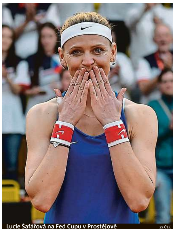
Lucie Šafářová na Fed Cupu v Prostějově