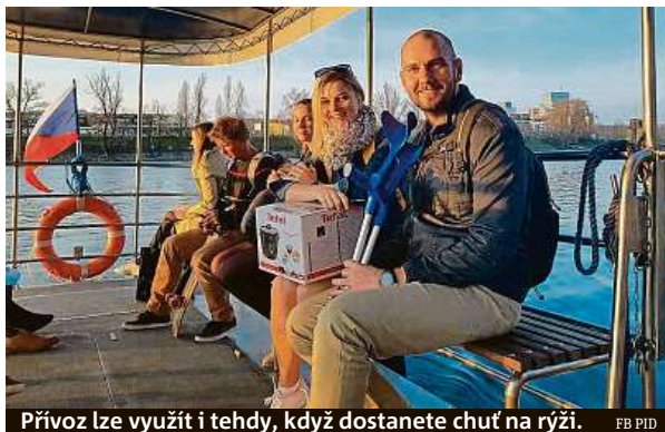
Přívaz lze využít i tehdy, když dostanete chuť na rýži. FB PID

Řadě pražských spojů přes hladinu Vltavy začala sezona teprve před pár týdny. Organizátor dopravy Ropid se je proto snaží v těchto dnech rádně zpropagovat. Minulý týden se pochlubil kapitánem Fran-