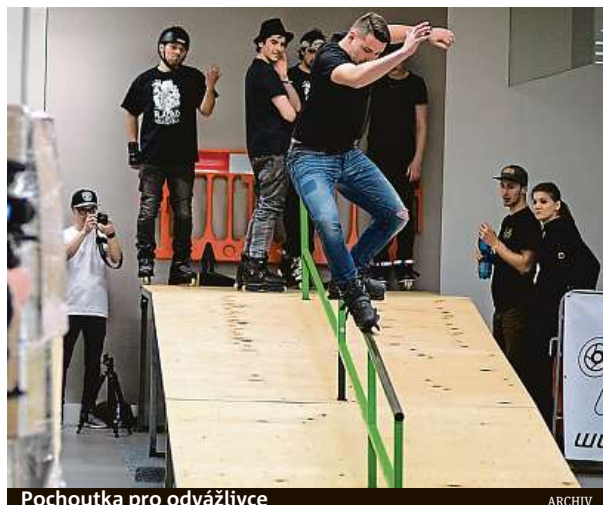
Pochoutka pro odvážlivce