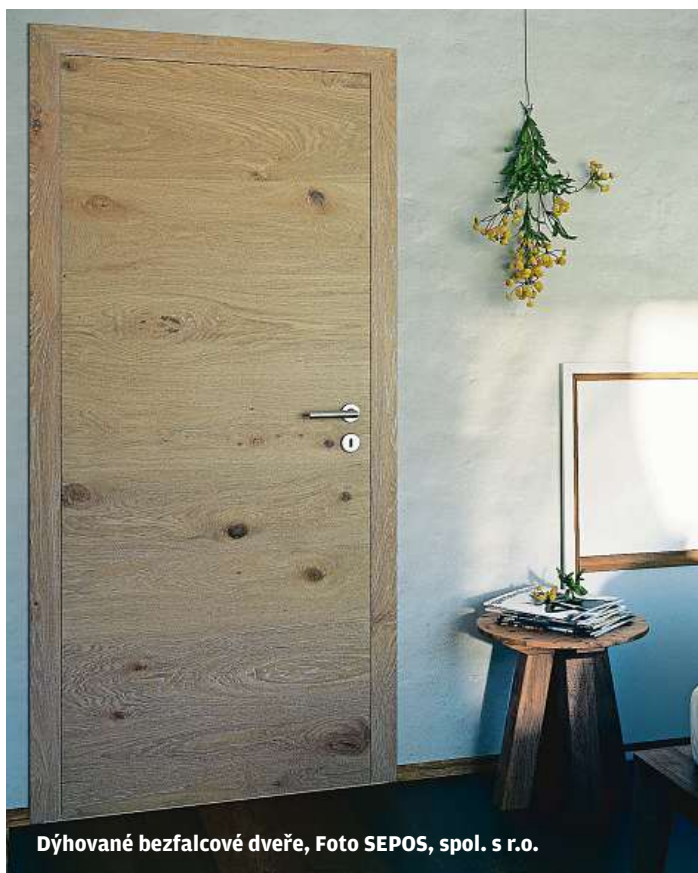
Dýhované bezfalcové dveře, Foto SEPOS, spol. s r.o.

Dveře s dýhovaným povrchem jsou vhodnou volbou pro všechny, kteří ocení originalitu a přirozenou texturu dřeva.