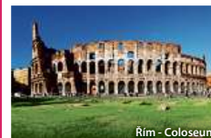
Řím - Colosseum