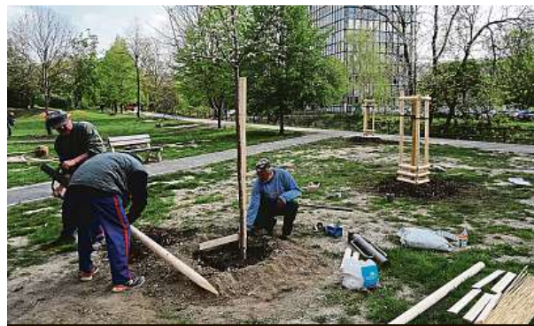
Zahradníci připravují stromy poblíž Jivenské ulice. 2x MČ Praha 4