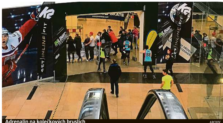
Adrenalin na kolečkových bruslích