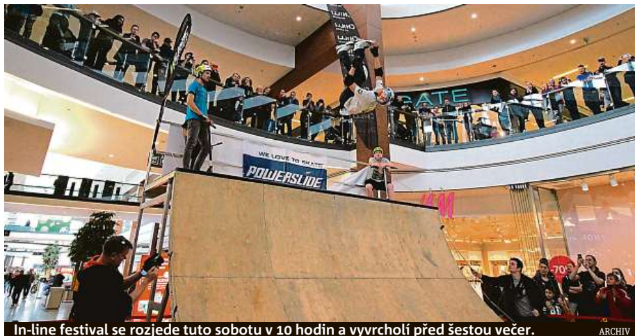
In-line festival se rozjede tuto sobotu v 10 hodin a vyvrcholí před šestou večer.

Lákadlem pro veřejnost je především exhibice profesionálních jezdců na U-rampě a Street zóně na aggressive bruslích. Svou účast přislíbili také profesionální