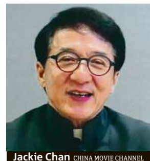
Jackie Chan CHINA MOVIE CHANNEL

Festival Týden čínského filmu startuje právě dnes.