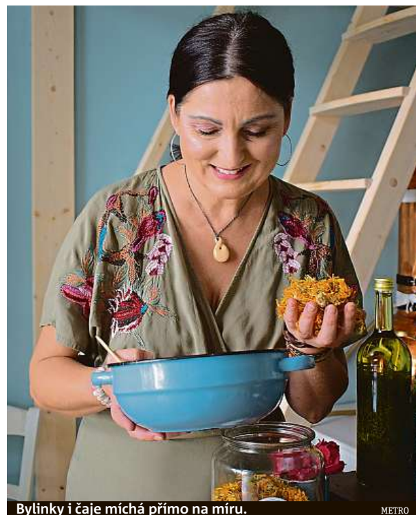
Bylinky i čaje míchá přímo na míru. METRO

Zákaz účasti na hazardních hrách a registrace osob mladších 18 let.