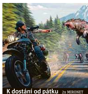
K dostání od pátku 2x MIRONET

Existuje řada důvodů, proč Days Gone stojí za pozornost. Příběh hry se odehrává v prostředí, které je videohrami dosud neprozkoumané. Vžijte se do role bývalého psance Deacona St. Johna, který jen s motorkou a svými schopnostmi přežívá na severozápadě USA. Lidstvo zasáhla brutální zombie pandemie, nejedná se tedy o žádnou klidnou projíždku. Nebezpečí