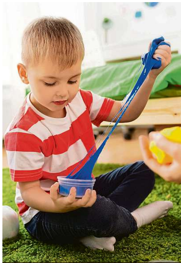
Děti ho milují.