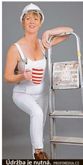
Udržba je nutná.