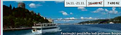
Fascinující projížďka lodí průlivem Bospor