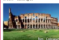
Řím - Coloseum