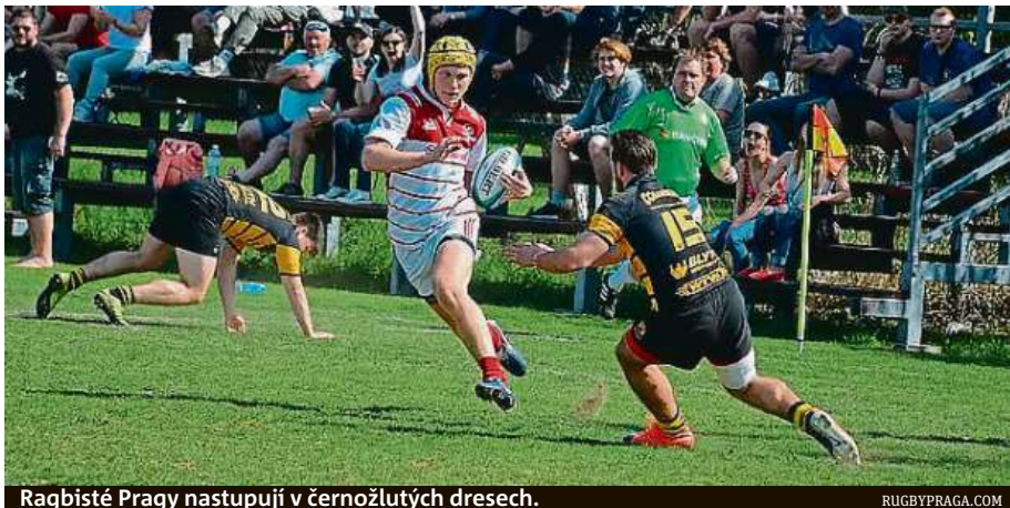
Ragbisté Prahy nastupují v černožlutých dresech.

Psal se rok 1944 a Evropou zmítala válka. Pod záštitou Červeného kříže shazovalo britské letectvo na Prahu a další města balíčky určené pro civilní obyvatelstvo. Jeden z nich se však svým obsahem vymykal. Pražané v něm našli ragbyový míč a čtyři černožluté dresy ragbyového klubu z anglického Canterbury. Pár měsíců nato byl v pražských Vysočanech založen ragbyový oddíl. V průběhu 75 let se stal klub historicky nejúspěšnějším na území Česka, celkem sedmnáctkrát