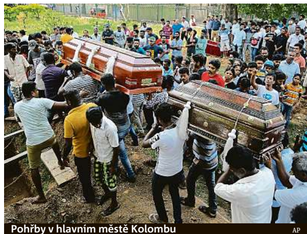
Pohřby v hlavním městě Kolombu

Úřady připisují masakr, kvůli němuž byl v zemi vyhlášen výjimečný stav, místní dosud málo známé islamistické skupině Tauhid džamátě, označované zkratkou NTJ. Včera se ale prostřednictvím propagandistické agentury Amak k atentátům přihlásil Islámský stát. „Pachatelé útoku, jehož terčem byli především občané země koalice a křesťané na Srí Lance, pocházejí z řad bojovníků Islámského státu,“ uvedla agentura. Nezveřejnila nicméně žádné fotografie ani videonahrávky, na nichž by bylo vidět útočníky přísahat věrnost