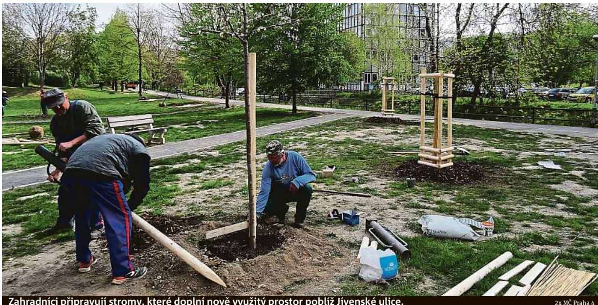
Zahradníci připravují stromy, které doplní nově využitý prostor poblíž Jivenské ulice.

Na novou výsadbu naváže rekultivace trávníků a v rezervě jsou ještě dva duby. MET