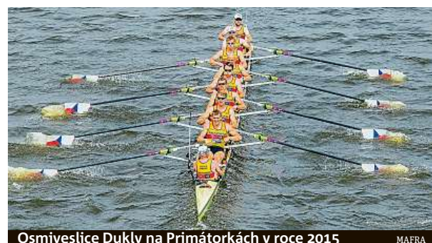
Osmiveslice Dukly na Primátorkách v roce 2015