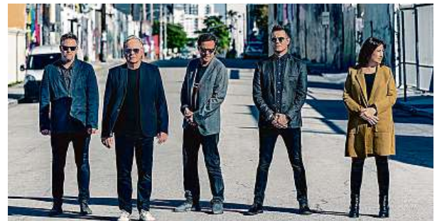
Britská postpunková formace