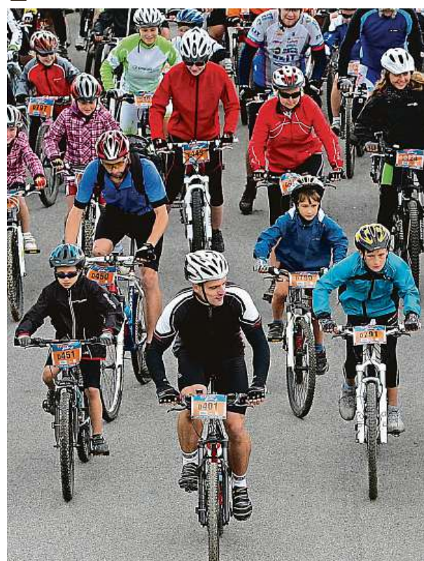
Cyklozávodů pro celou rodinu

Připravena je také celá řada celoročních soutěží: Prestige Trophy Marathon - soutěž jednotlivců, Team Prestige Trophy (Race a Hobby) - soutěž týmů, dětská soutěž v kreslení a spousta dalších klání pro děti v nové Dětské zóně ŽPMV ČR, Dětském klubu pro nejmenší, na pumptrackové dráze Chupa Chups, Bike Academy KPŽ a na stáncích partnerů v zázemí akcí.