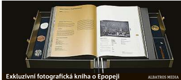
Exkluzivní fotografická kniha o Epopeji

Muchova Slovanská epopej představuje imponující monumentální cyklus, jež v moderním umění nemá obdoby. Stovky postav umístěných ve věrohodných seskupeních jsou malovány technikou vaječné tempéry, doplňovanou jen střídmě olejem, která přežila bez velkých úhon téměř sto let mnohdy nešetrného zacházení. Obavy z případného poškození nebo ztráty Epopeje zapříčinily vznik projektu jejího digitálního zachycení. Přímým a logickým důsledkem této fotografické dokumentace bylo rozhodnutí vydat dílo knižně. Právě tak vznikl nejnáročnější projekt v historii nakladatelského domu Albatros Media a také