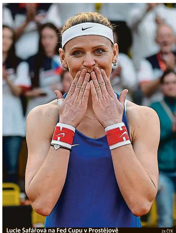
Lucie Šafářová na Fed Cupu v Prostějově