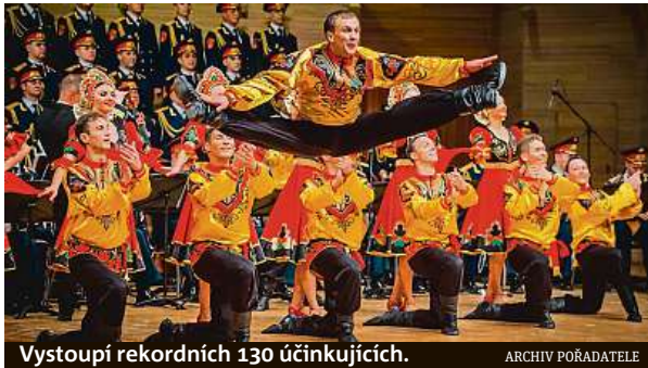
Vystoupí rekordních 130 účinkujících.

Ruský soubor Alexandrovci slaví letos kulaté 90. výročí a vyjždí na velké evropské turné. Po tragédii, která soubor zasáhla při leteckém neštěstí v prosinci 2016, se soubor v plné síle vrací na koncertní pódia, na kterých poprvé v historii vystoupí re-