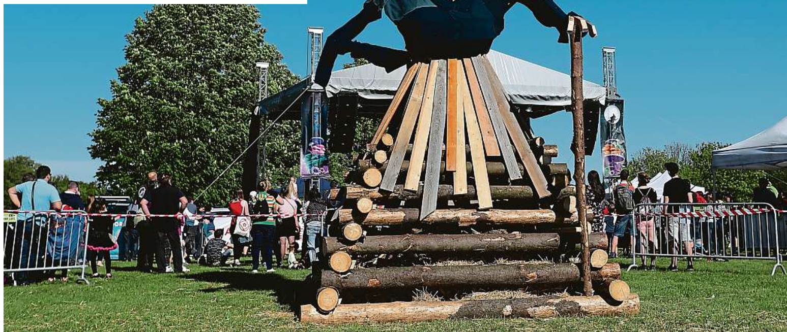
Zdali všechny čarodějnické ohně vzplanou, není vůbec jisté. V Praze kvůli suchému počasí zatím platí zákaz rozdělávání ohňů.