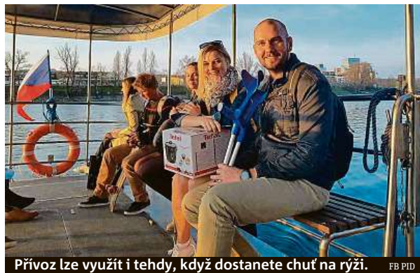
Přívoz lze využít i tehdy, když dostanete chuť na rýži. FB PID

Řadě pražských spojů přes hladinu Vltavy začala sezona teprve před pár týdny. Organizátor dopravy Ropid se je proto snaží v těchto dnech rádně zpropagovat. Minulý týden se pochlubil kapitánem Fran-