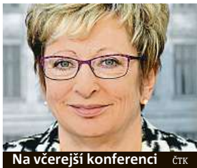
Na včerejší konferenci ČTK

Končící ministryně Nováková hodnotila svou práci. Podle ní se jí řada věcí povedla.