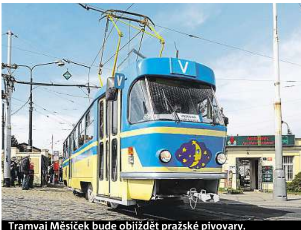
Tramvaj Měsíček bude objíždět pražské pivovary.