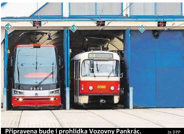
Připravena bude i prohlídka Vozovny Pankrác. 3x DPP