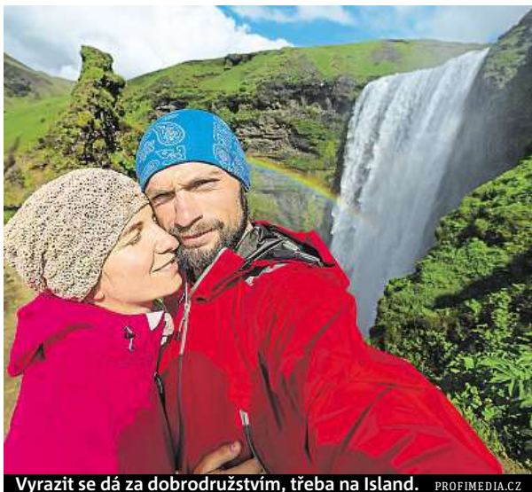
Vyrazit se dá za dobrodružstvím, třeba na Island.

Romantiku můžete najít téměř kdekoli, třeba i uprostřed New Yorku. I když se budete Central Parkem toulat celé hodiny, vždy narazíte na nové, ještě krásnější místo. Až vás budou bolet nohy, můžete si půjčit člun a užít si plavbu po hladině jezera. Při procházce po Brooklyn Promenade máte nejlepší výhled na panorama Manhattanu a Brooklynského mostu. Cestou se zastavte v River Café, odkud máte výhled na Sochu svobody. Za uměním můžete zajít do Metropolitního muzea. Dalším romantickým místem je na břehu East River v Gantry Plaza State Parku, kde můžete pozorovat západ slunce.