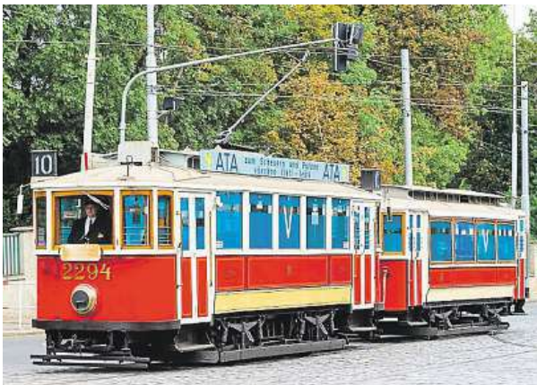
Výročí operace Anthropoid připomene vyjízdka.