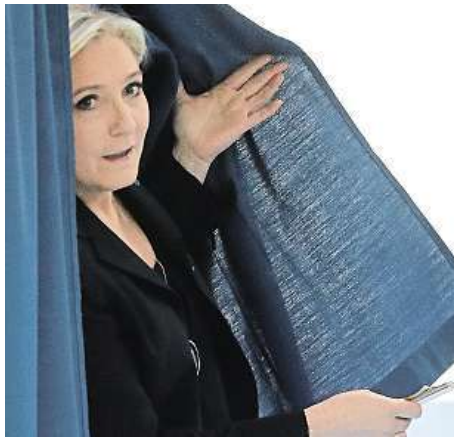
Na severu Francie odvolili Marine Le Penová i Emmanuel Macron s manželkou.

Případná vyšší účast může být výhodou pro Macrona, který nemá stabilní voličskou základnu a který se opí-