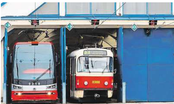
Připravena bude i prohlídka Vozovny Pankrác. 3x DPP