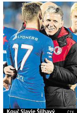
Kouč Slavie Šilhavý

Slavia vedla tabulku od pátku, kdy v předešlé porážce venku Slovácko. Pod koučem Jaroslavem Šilhavým sešívání dál jen vítězí či remizují, sérii bez prohry natáhli už na 21 ligových zápasů. SIM