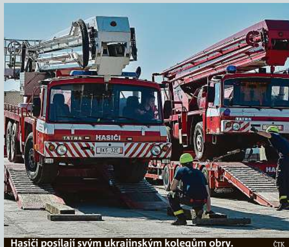
Hasiči posílají svým ukrajinským kolegům obry. ČTK

Město Ostrava vypoví partnerské smlouvy s ukrajinským Doněckem a ruským Volgogradem. Rozhodli o tom zastupitelé. Obdobně před týdnem zareagoval také Moravskoslezský kraj. Jeho zastupitelé rozhodli o ukončení partnerských vztahů s Volgogradskou oblastí v Ruské federaci. ČTK