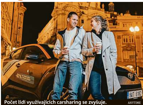
Počet lidí využívajících carsharing se zvyšuje.

„Za poslední rok sledujeme další nárůst zájmu o sdílené automobily, což nám potvrzuje i čerstvý průzkum, který pro nás zpracovala agentura STEM/MARK. Na šestiprocenní nárůst reagujeme dalším rozšiřováním naší