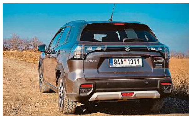
Nové jsou i zadní lampy, které spojuje horizontální linka.

Nízká hmotnost 1,4 tuny ve spojení s AllGrip Select dělá z S-Crossu dravce v terénu. Není to drsný off-road, ale mezinápravová spojka zejména v režimu Lock vyhraje auto i z hodně zapeklitých situací. PETR HOLEČEK