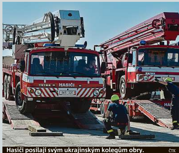
Hasiči posílají svým ukrajinským kolegům obry. ČTK

Město Ostrava vypoví partnerské smlouvy s ukrajinským Doněckem a ruským Volgogradem. Rozhodli o tom zastupitelé. Obdobně před týdnem zareagoval také Moravskoslezský kraj. Jeho zastupitelé rozhodli o ukončení partnerských vztahů s Volgogradskou oblastí v Ruské federaci. ČTK