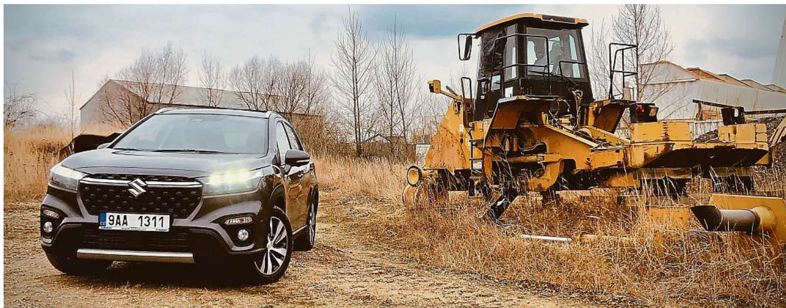
S-Cross je zajímavá volba také cenově. Základní cena startuje na 509 tisících. Nejlevnější čtyřkolku koupíte za 578 tisíc korun.