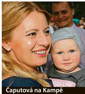
Čaputová na Kampě

Českem dlouhodobě cloumá otázka, zda jsme připraveni zvolit si ženu do čela země. Většina Čechů je pro.