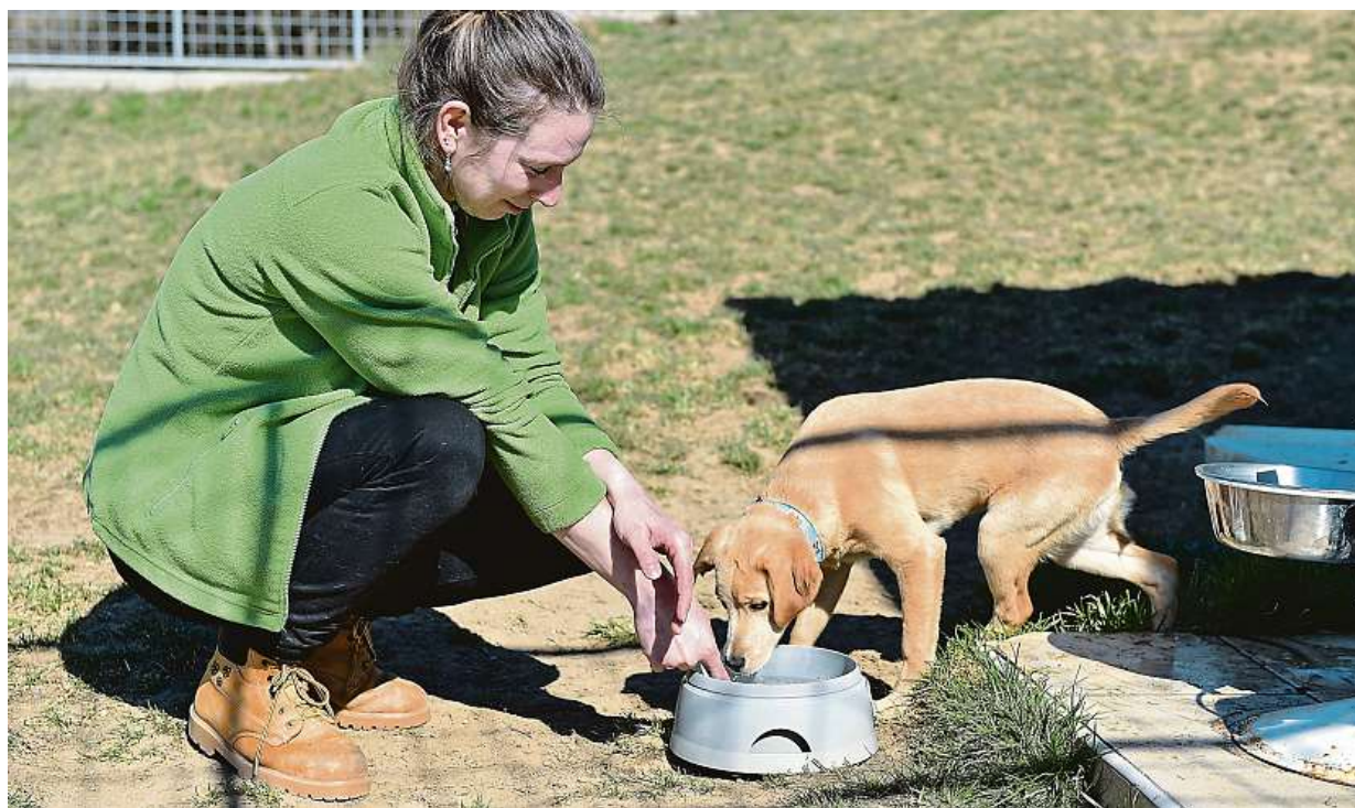
Utulek brněnské městské policie je připravený přijmout bezplatně až na 15 dnů přes 30 psů a koček uprchlíků z Ukrajiny.

Válka na Ukrajině. Česko se potýká s přílivem uprchlíků. Radnice Prahy 6. Ukrajinské děti chce vzdělávat v bývalé ruské škole. Volné byty. Praha 7 má záslusk na dům, v němž bydleli vyhoštění Rusové STRANA 4