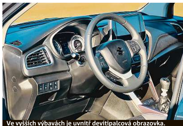
Ve vyšších výbavách je uvnitř devítipalcová obrazovka.