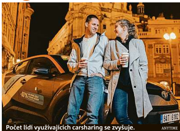
Počet lidí využívajících carsharing se zvyšuje.

„Za poslední rok sledujeme další nárůst zájmu o sdílené automobily, což nám potvrzuje i čerstvý průzkum, který pro nás zpracovala agentura STEM/MARK. Na šestiprocenní nárůst reagujeme dalším rozšiřováním naší