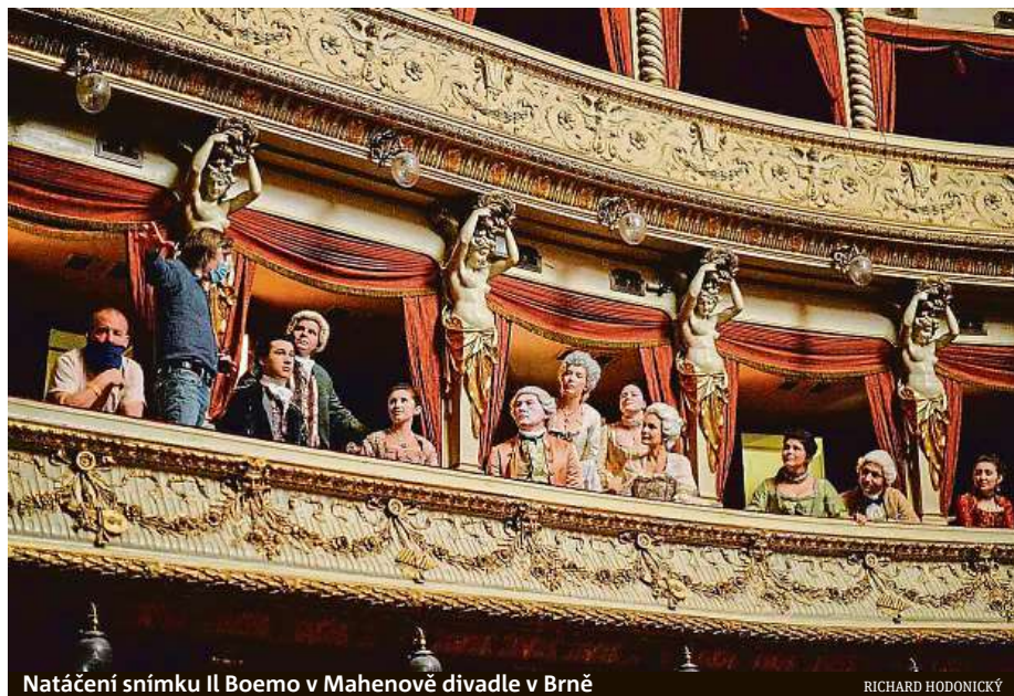
Natáčení snímku Il Boemo v Mahenově divadle v Brně