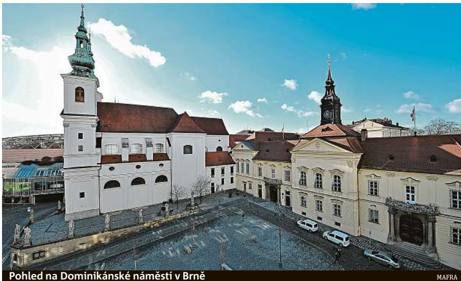
Pohled na Dominikánské náměstí v Brně

Brno v roce 2018 zrekonstruovalo náměstí za více než sedmdesát milionů korun. Zmizela z něj parkovací místa, naopak se objevily stromy. Na přelomu let 2019 a 2020 se uskutečnila architektonicko-výtvarná soutěž na doplnění náměstí o dva vodní prvky, ale žádný z ná-