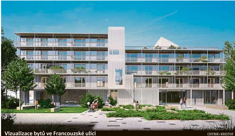
Vizualizace bytů ve Francouzské ulici

Projekt nyní vstupuje do fáze zpracovávání dokumen-