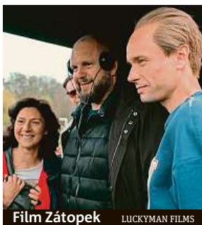
Film Zátopek