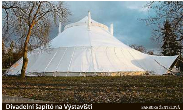
Divadelní šapitó na Výstavišti

Na Výstavišti v Holešovicích vyrostlo divadelní šapitó. Jde o letní scénu projektu Jatka78.