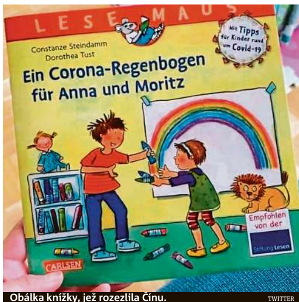
Obálka knížky, jež rozezílala Čínu.

Knihy dětem vysvětluje, jak virus způsobuje „dalekosáhlé změny v každodenním životě“ a že je potřeba dodr-