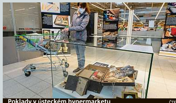
Poklady v ústeckém hypermarketu

Historici vystavují v hypermarketu v Ústí nad Labem poklady, které získali během epidemie koronaviru. Nezvyklou cestu, jak zprostředkovat přiběhy věcí veřejnosti, zvolili z důvodu uzavření muzea kvůli nařízením. ČTK