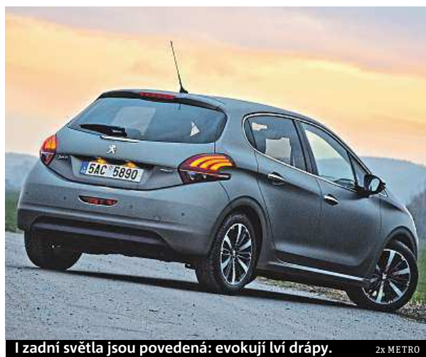
I zadní světla jsou povedená: evokují lví drápy.