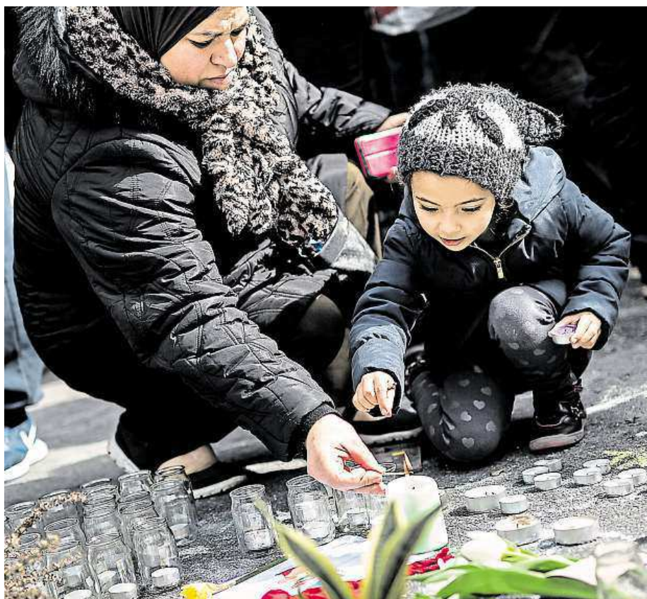
Pieta. Lidé včera v Bruselu zapalovali svíčky za oběti úterních útoků.