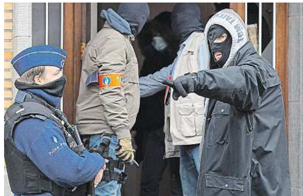
Razie na bruselském předměstí Anderlecht.

Razie pokračují, lidé se bojí dalších teroristických útoků.