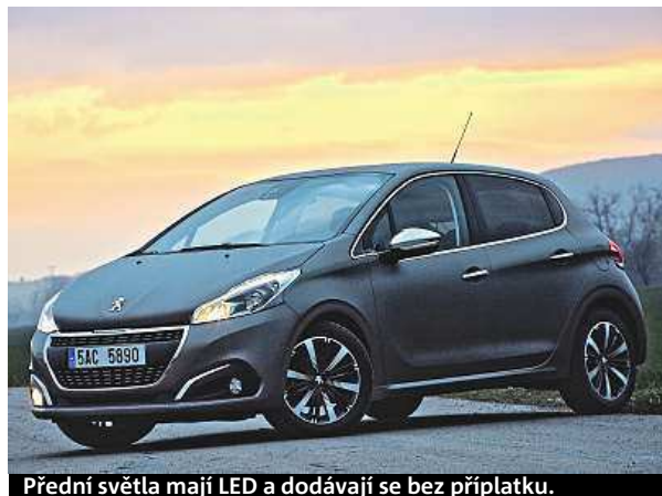
Přední světla mají LED a dodávají se bez příplatku.

Tři roky po uvedení na trh se model 208, zatím poslední nástupce populárního Peugeotu 205, dočkal nového vzhledu. Malé autíčko hodící se spíše do města dřív vyhovovalo hlavně ženám, dnes má výraznější a sportovnější design a začínají po něm pokukovat i chlapi. Stále bojuje proti levnější fabii (základ 1.0 MPI/44 kW je za 240 tisíc), která nabízí větší kufr, ale milovníci francouzského designu nebo ti, kteří prostě rádi peugeoty, musí novou 208 se základní cenou 259 tisíc korun za čtyřdveřovou verzi brát v úvahu. U nejsilnější testované verze s naftovým čtyřválcem 1.6 BlueHDi (slabší motory z nabídky výbavou Allure (cena 423 700 Kč) už je srovnání s konkurenční těžší. Tohle auto má ale ďáblíka v těle a 120koňový motor se pro jeho 1,2 tuny hodí. Není to sice 200koňová 208 GTI, ale má odpích, sedí v zatáčkách a s lehkou nohou se dostanete na pětilitrovou spotřebu. PETR HOLEČEK