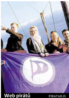
Web pirátů PIRATAR.IS

„Tradiční politika nevykazuje žádný pokrok a lidé jsou unavení čekáním na změnu. Je dobře, že lidé odmítají korupci a aroganci,“ vysvětluje