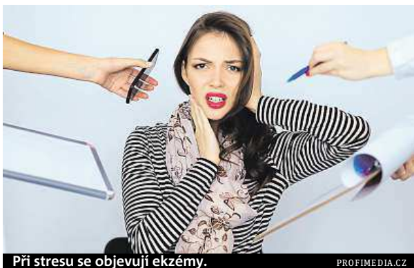
Při stresu se objevují ekzémy.

Na vině může být alergie včetně té zkřížené, nesnášen-