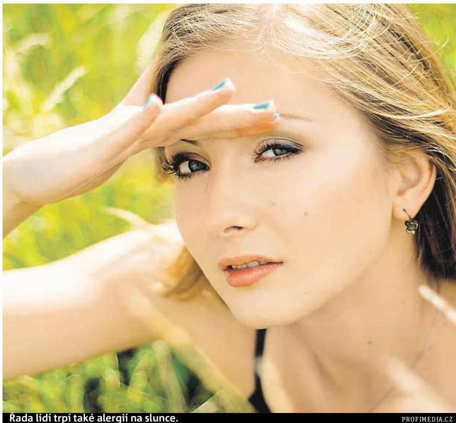
Rada lidí trpí také alergií na slunce.

Podle homeopatie je alergie narušením takzvané vitální síly a absolutním oslabením imunitního systému, které může být odstraněno homeopatickým lékem. V léčbě alergií může být homeopatie velmi úspěšná. Homeopatie se dělí na několik směrů, z nichž nejznámější jsou symptomatická homeopatie a konsti-