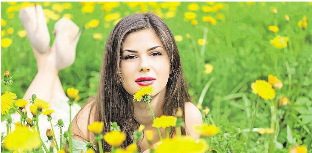
Pokud vám na rozdíl od ženy na snímku příchod jarních dní nedělá dobře, měli byste určitě navštívit lékaře.

Možná byste se divili, že cesta k možnému zlepšení vašeho stavu nemusí být nijak složitá, natož pak nebezpečná. Tuto cestu můžeme zvolit i jako preventivní, abychom pouze nehasili požár, ale vů-