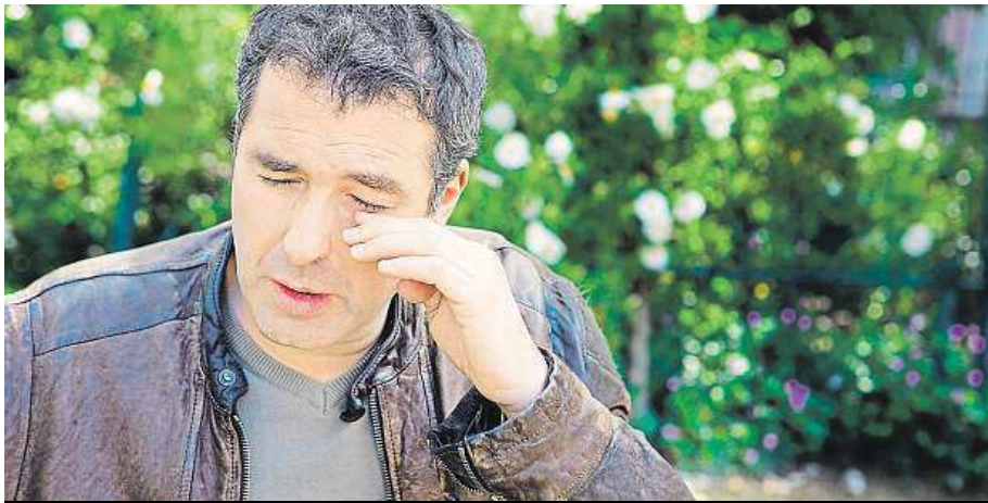
Alergický zánět spojivek většinou doprovází pylovou rýmu.