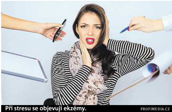
Při stresu se objevují ekzémy.

Na vině může být alergie včetně té zkřížené, nesnášen-