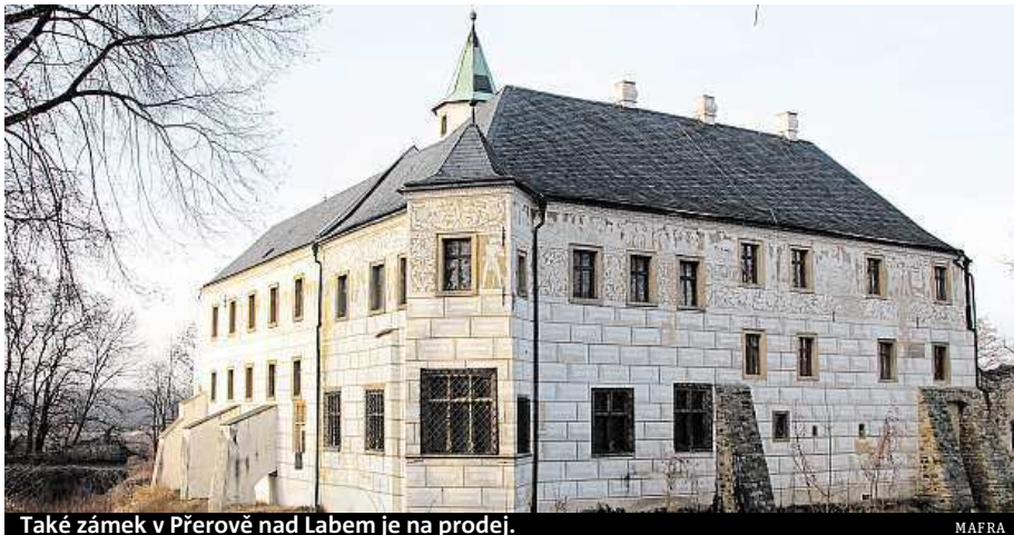
Také zámek v Přerově nad Labem je na prodej.

Prodej historických objektů trvá podle něj většinou několik let. Nejčastějším kupujícím je podnikatel nad padesát let, který objekt chce pře-