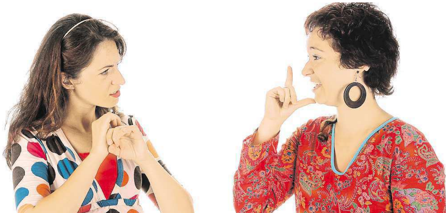
There are many similarities between spoken languages and sign languages.