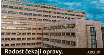
Radost čekají opravy.