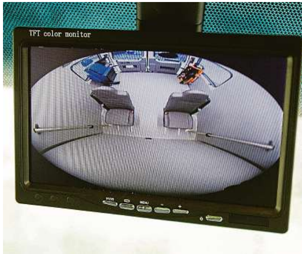
Díky kameře jsou převázení opilci pořád pod kontrolou. MPP

V metropoli zajišťuje svoz podnapilých osob již patnáctým rokem speciální hlídka pražských strážníků. Říká se jí Astra 150 a kmenovou základnu má tato skupina sestávající z osmi speciálně vyškolených odborníků na obvodním ředitelství v Praze 1. „Ale svoz zajišťuje pro celou oblast Prahy ve 24hodinovém režimu. Jedná se o jedinou