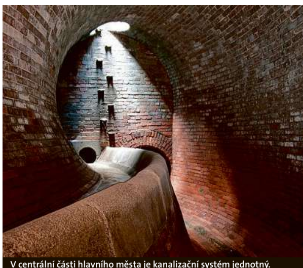
V centrální části hlavního města je kanalizační systém jednotný.