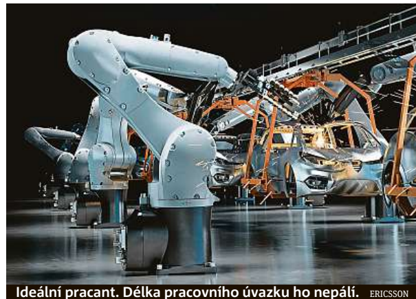
Ideální pracant. Délka pracovního úvazku ho nepálí. ERICSSON

Pro matky s malými dětmi, jejichž výdělek doplňuje rodinný rozpočet, je často práce jen na část dne ideální. Obecně po ní ale většina lidí netouží.