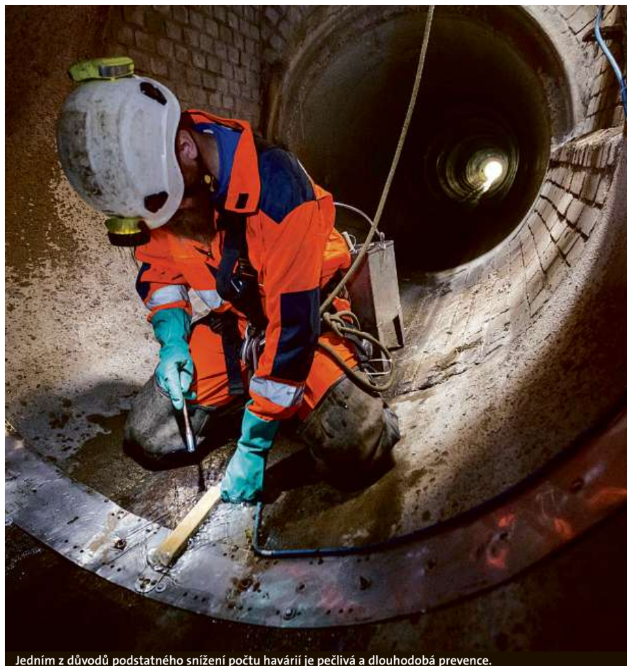
Jedním z důvodů podstatného snížení počtu havárií je pečlivá a dlouhodobá prevence.

Při prohlídce stokové sítě je zpracován protokol z prohlídky s videozáznamem a mapovým podkladem prohlíženého úseku stoky. V případě závad zpracují PVK návrh na odstra-