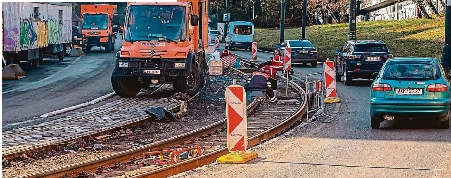
Opravuje se nejčastěji v Praze. Tramvajová trať v Chotkově ulici je extrémně vytížená – ve všední den tu po kolejích jezdí jedna tramvaj každých 75 vteřin. ROPID