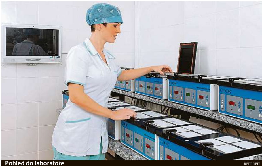
Pohled do laboratoře

„Takzvané laboratoře na čipu jsou základem moderních laboratorních technologií. Mikrofluidika umožňuje práci s velmi malými objemy v prostředí kanálek různé šířky, asi šířky lidského vlasu. Tyto kanálky jsou vylišané většinou do skleněné destičky – čipu. Spermie musí díky