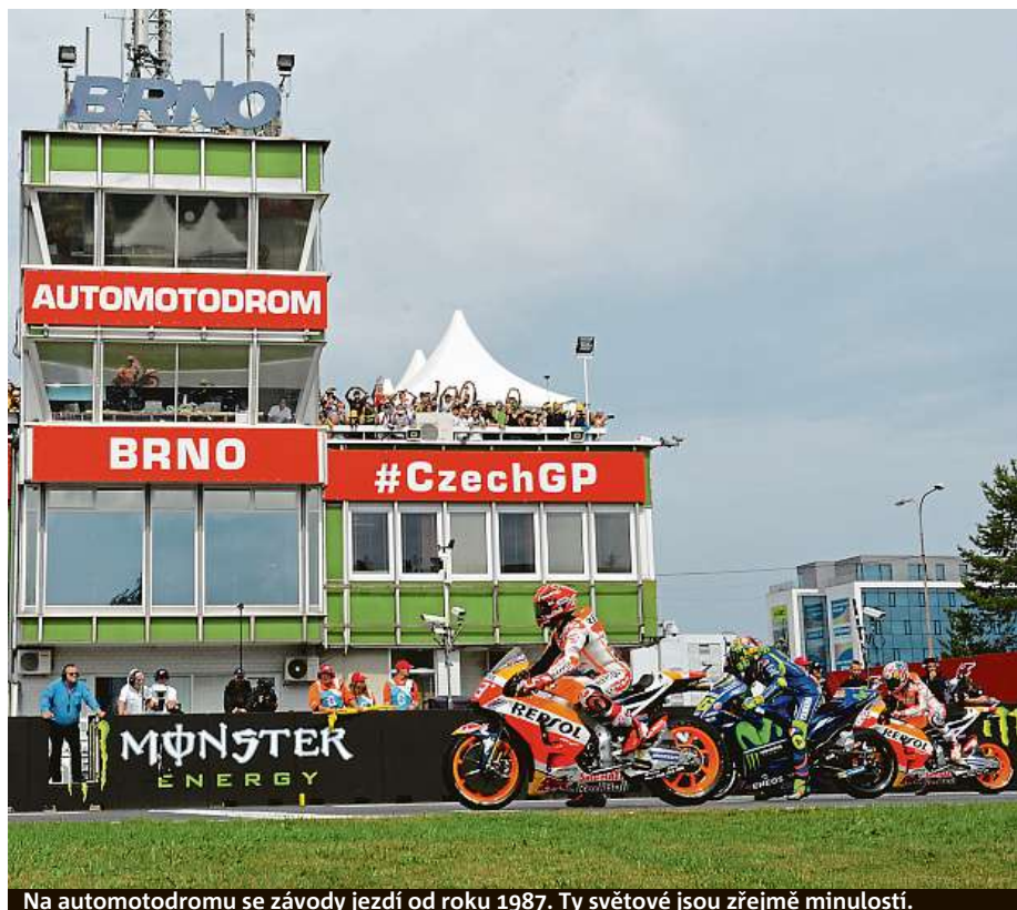
Na automotodromu se závody jezdí od roku 1987. Ty světové jsou zřejmě minulostí.

Budoucnost Masarykova okruhu? Místo světových závodů možná budou stavební parcely.