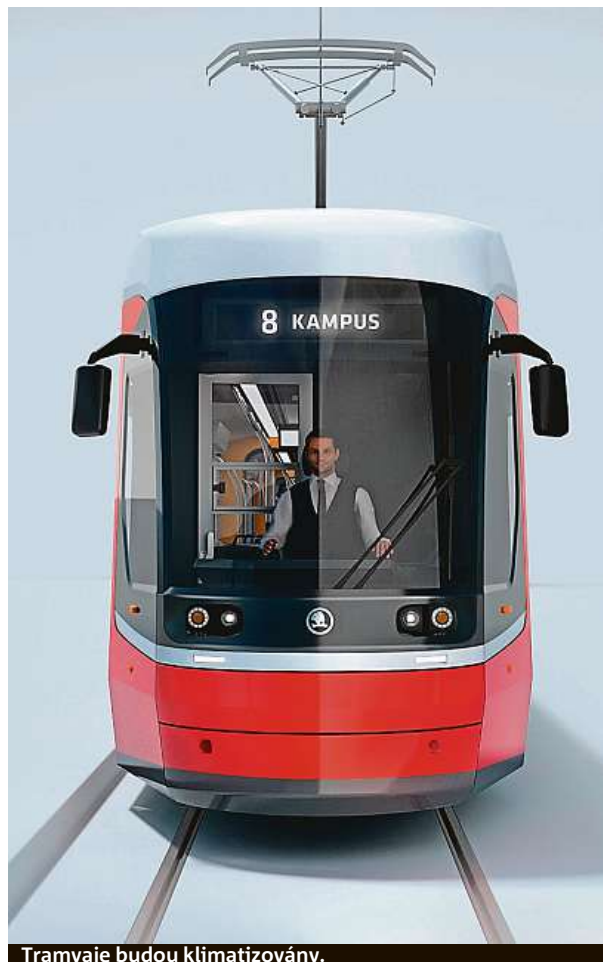
Tramvaje budou klimatizovány.