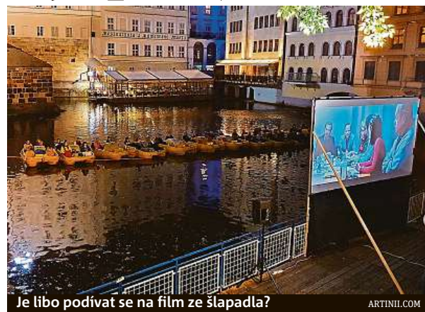
Je líbo podívat se na film ze šlapadla? ARTINIIL.COM

Technologie společnosti hrála v roce 2020 klíčovou roli například při dodání filmů pro více než 50 projekcí v rámci Mezinárodního filmového festivalu Karlovy Vary či pro menší klienty a letní kina.