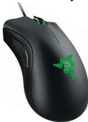
Tip pro hráče MIRONET

Naváhejte tedy a zapojte se do světa PC gamingu se stylovým příslušenstvím od značky Razer. Myš DeathAdder Essential zakoupíte v internetovém obchodě Mironet.cz v rámci akce Bomba slevy za skvělých 890 korun.