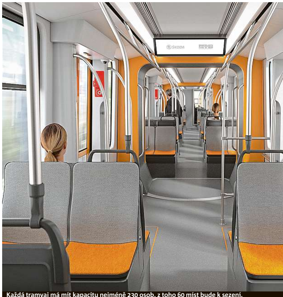
Každá tramvaj má mít kapacitu nejméně 230 osob, z toho 60 míst bude k sezení.