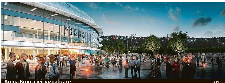
Arena Brno a její vizualizace