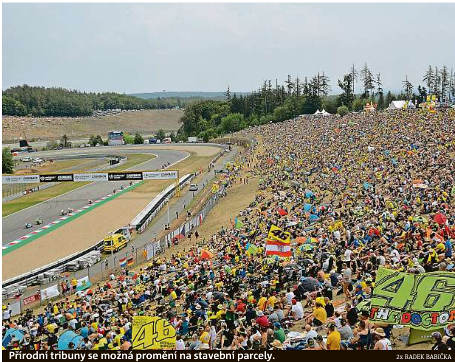
Přírodní tribuny se možná promění na stavební parcely.

Zatímco fanoušci motorismu už se v internetových dis-