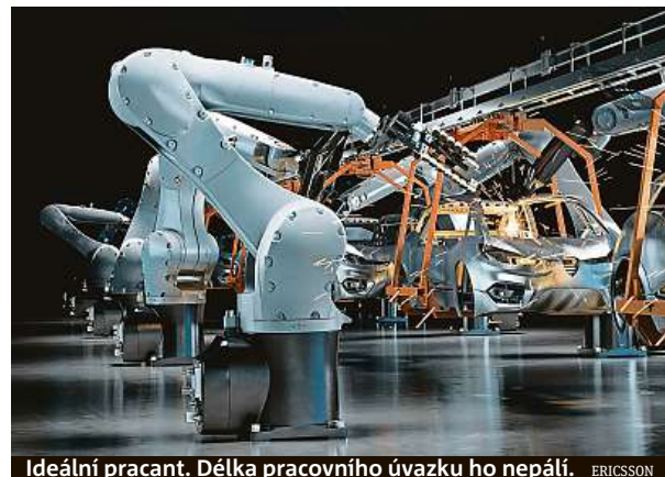
Ideální pracant. Délka pracovního úvazku ho nepálí. ERICSSON

Pro matky s malými dětmi, jejichž výdělek doplňuje rodinný rozpočet, je často práce jen na část dne ideální. Obecně po ní ale většina lidí netouží.