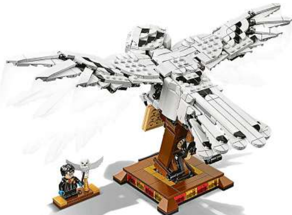
Model sovy Hedviky je tvořený 630 dílky. MIRONET

Sběratelský model Hedviky od LEGO nabízí zábavný stavitelský zážitek a skvěle se vyjímá na výstavce. Tento model tvořený 630 dílky s rozpětím křídel přes 34 cm zachycuje Hedviky v letu, jak doručuje důležitý dopis. Až bude model hotový, ovládejte pohyb kloubových křídel nahoru a dolů tím, že budete otáčet rukojetí. Sběratelský model stojí na robustní podložce s odnímatelnou minifigurkou od LEGO Harry Potter a druhou, menší figurkou sovy Hedviky s roztaženými křídly. Tato stavebnice nevy-