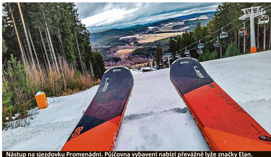
Nástup na sjezdovku Promenádní. Půjčovna vybavení nabízí převážně lyže značky Elan.

jako nosič slouží karta hosta Lipno card, kam si skipasy ly- žaři nabíjí. „Celé se to propojí s jejich registrovaným online účtem. Při další návštěvě si tak mohou skipas nakoupit přes internet z domova a na Lipně vyrazit rovnou k turni- ketům,“ říká mluvčí areálu Jiří Falout. Po celedenní lyžo- vačce lze navštívit bobovou dráhu, akvapark, stezku ko- runami stromů nebo hopsárium. PETR HOLEČEK