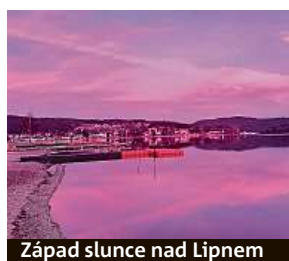
Západ slunce nad Lipnem