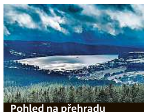
Pohled na přehradu