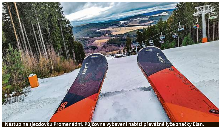
Nástup na sjezdovku Promenádní. Půjčovna vybavení nabízí převážně lyže značky Elan.

jako nosič slouží karta hosta Lipno.card, kam si skipasy lyžaři nabíjí. „Celé se to propojí s jejich registrovaným online účtem. Při další návštěvě si tak mohou skipas nakoupit přes internet z domova a na Lipně vyrazit rovnou k turniketům,“ říká mluvčí areálu Jiří Falout. Po celedenní lyžovačce lze navštívit bobovou dráhu, akvapark, stezku korunami stromů nebo hopsárium. PETR HOLEČEK