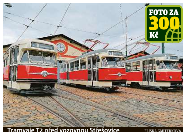
Tramvaje T2 před vozovnou Srešovice

„Nápad vrátit tramvaje T2 zpět do pražské MHD přišel ještě předtím, než poslední vůz Dopravní podnik měst Liberce a Jablonce nad Nisou v listopadu 2018 definitivně vyřadil z provozu. Realizace tohoto projektu se tak povedla v poměrně krátkém čase,“