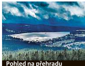
Pohled na přehradu