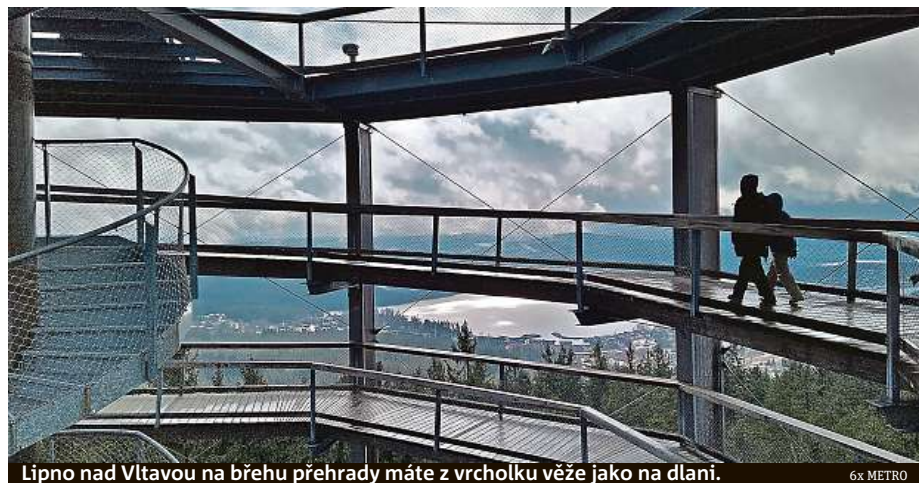
Lipno nad Vltavou na břehu přehrady máte z vrcholku věže jako na dlani.

Zajímavá je stezka v letních měsících. Návštěvníci tu totiž mohou zažít romantické chvíle při večerní procházce nad korunami stromů. Každé úterý v červenci a v srpnu je otevřeno do 23 hodin. Občas zde také hrají známí hudebníci a tak se můžete nad lesem nechat unášet na vlnách jazzu nebo klasiky. HOP