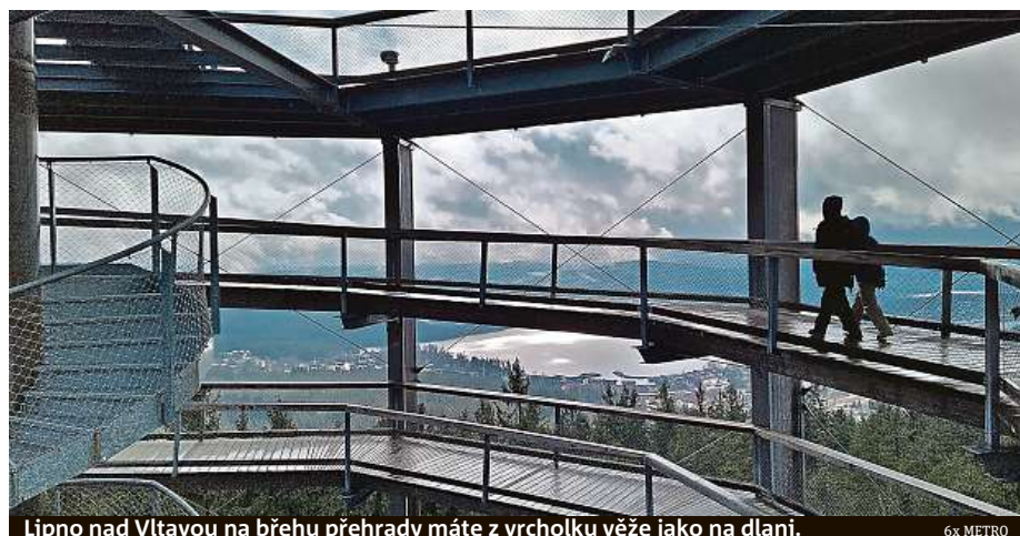
Lipno nad Vltavou na břehu přehradu máte z vrcholku věže jako na dlani.

Zajímavá je stezka v letních měsících. Návštěvníci tu totiž mohou zažít romantické chvíle při večerní procházce nad korunami stromů. Každé úterý v červenci a v srpnu je otevřeno do 23 hodin. Občas zde také hrají známí hudebníci a tak se můžete nad lesem nechat unášet na vlnách jazzu nebo klasiky. HOPE