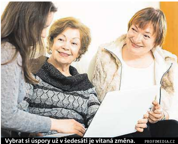
Vybrat si úspory už v šedesáti je vítaná změna.

Vítaná změna je také možnost vybrat si nasporené peníze už v 60 letech. Není tak nutné čekat na chvíli, kdy získáte nárok na výplatu státního důchodu. Navíc je možné si peníze nechat vyplácet jako penzi (musí to být aspoň na deset let), která je pak osvobozena od zdanění výnosů.