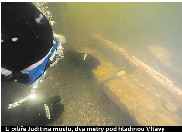
U pilíře Juitina mostu, dva metry pod hladinou Vltavy