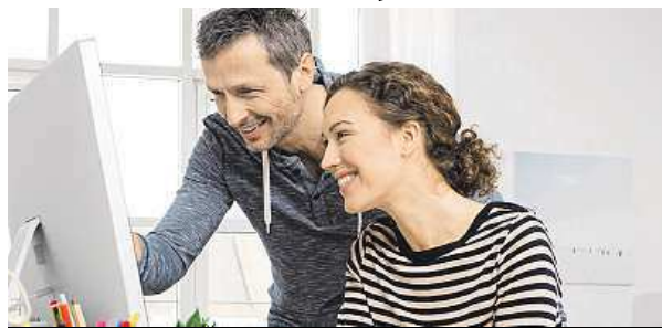
K úspěchu nepomůže jen vystudovat daný obor.

Klíčový je zájem o obor. „Umožňuje to věnovat se oboru naplno, trávit prací více času než ostatní,“ uvedl Schmid. Ulehčuje to také pílě a samostudium, které úspěšní lidé nejčastěji uvádějí mezi vlastnostmi, díky nimž úspěchu dosáhli. Na dělené první příčce skončila společně se samostudiem komunikativnost. Patří tam nejen schopnost hovořit, ale také umění naslouchat a získat smyslupl-