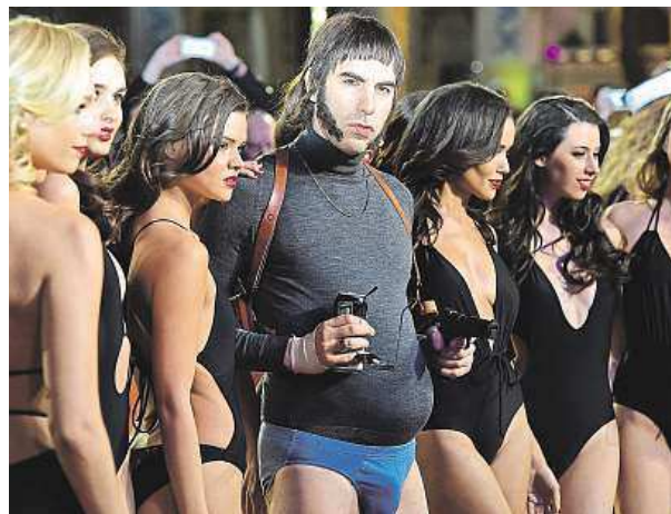
Sacha Baron Cohen v nové roli fotbalového blázna

Nobby žije v severoanglickém městě Grimsby. Má devět dětí a atraktivní přítelkyni. Celý život pátrá po svém mladším bratru Sebastianovi, od kterého byl odloučen v dět-