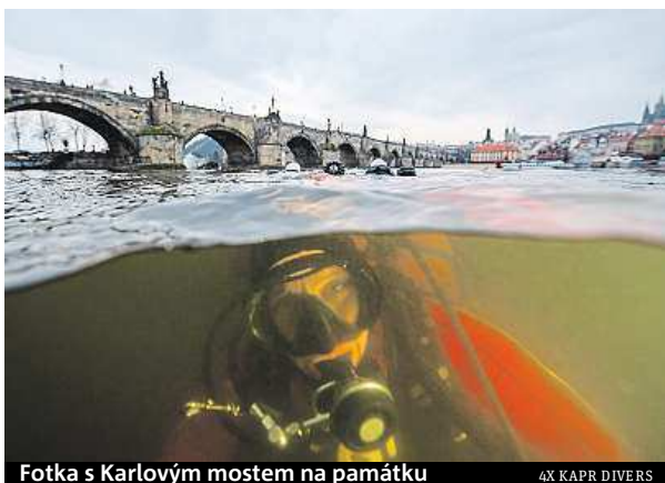
Fotka s Karlovým mostem na památku

Na zimu spojenou s výzkumem jsou ale potápěči podle Slezáka připravení. „Když se několik hodin koupete ve studené vodě, tak vám teplo není, ale už jsme na to zvyklí,“ vysvětluje potápěč. Na chlad se podle něj dá dobře připravit dobrým vybavením. ROBERT OPPELT