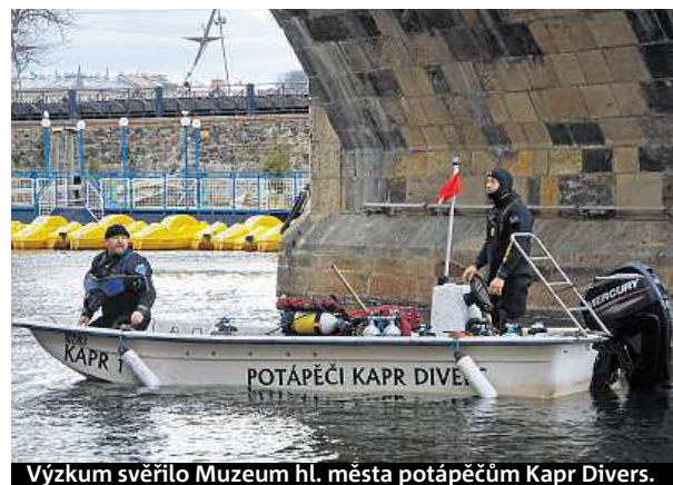
Výzkum svěřilo Muzeum hl. města potápěčům Kapr Divers.