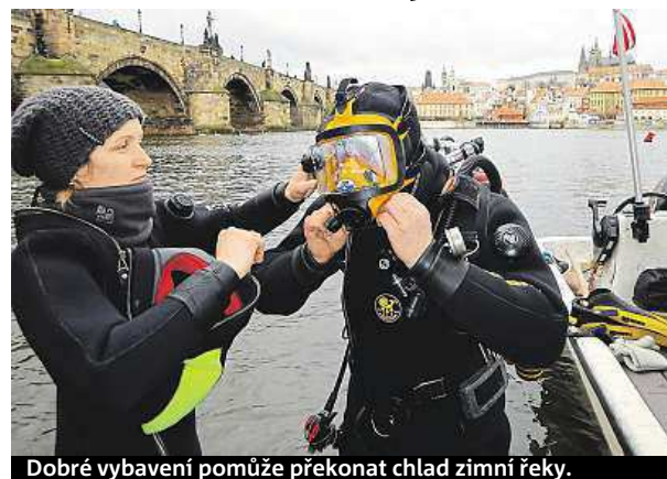
Dobré vybavení pomůže překonat chlad zimní řeky.