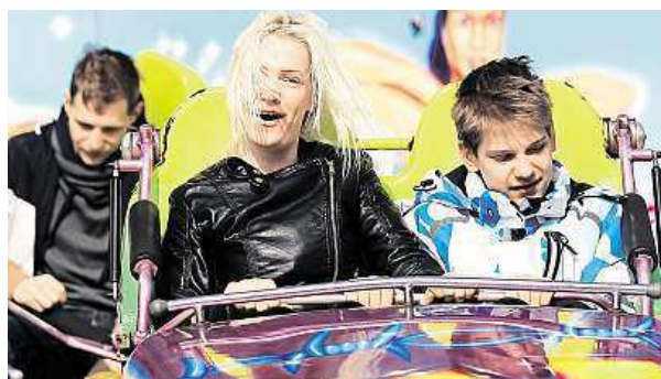
Horská dráha, autíčka, volný pád z devadesáti metrů – oblíbené atrakce