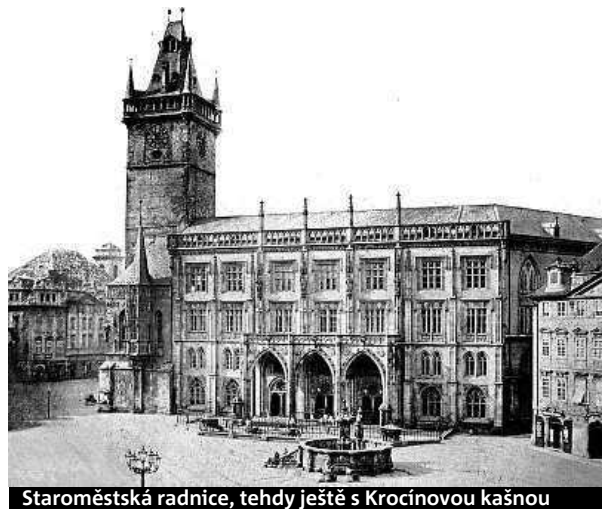
Staroměstská radnice, tehdy ještě s Krocínovou kašnou