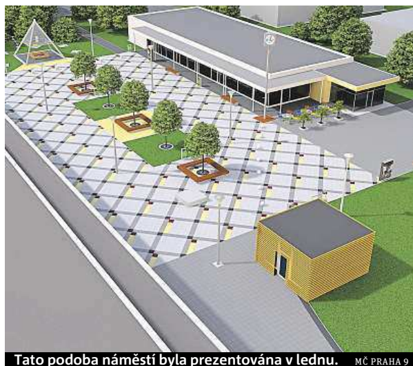
Tato podoba náměstí byla prezentována v lednu.