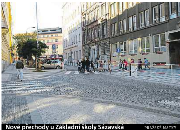
Nové přechody u Základní školy Sázavská

O tom, co je v jejich okolí nebezpečné, si děti rozhodují