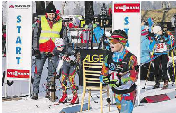
Start jednoho ze závodů biatlonového žactva

V březnu se zraky fanoušků přesunou na MS do Osla, podobně jako dětí z Roveru. „Pokud se potkáme na akci, tak většinou děti chtějí, abychom si biatlon pustili. Stejně tomu bude i nyní,“ dodává Novák. PAVEL URBAN