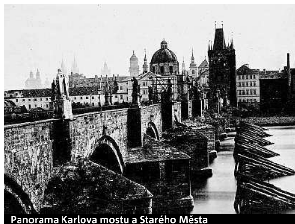
Panorama Karlova mostu a Starého Města