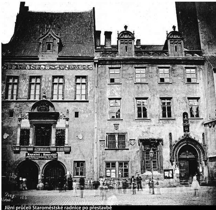
Jižní průčelí Staroměstské radnice po přestavbě

Mezi objednateli jeho fotografií byli architekti, stavitelé, historikové, archeologové, šlechta i průmyslové a dopravní společnosti. Díky nim vznikly například nejstarší dochované fotografie Prahy, hradu Rožmberk, zámku Lednice, dělnických osad v rumunském Banátu a mnoha dalších míst. row