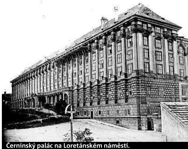
Černínský palác na Loretánském náměstí.