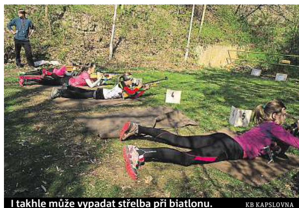
I takhle může vypadat střelba při biatlonu.