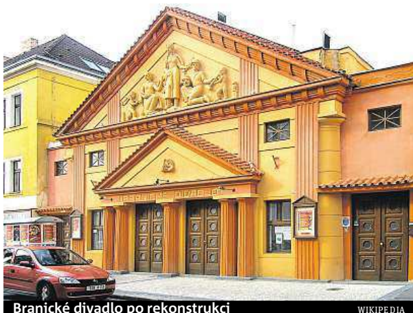
Branické divadlo po rekonstrukci