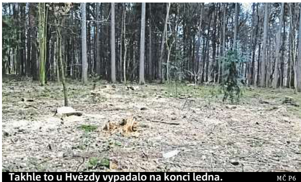
Takhle to u Hvězdy vypadalo na konci ledna.

„Pokácení několika desítek stromů údajně pomůže přiblížit zastoupení jednotlivých dřevin v oboře přirozenému složení porostů pro zdejší území,“ řekl deníku Metro Churavý. Duby červené i smrků by proto měly uvolnit místo pro přirozené