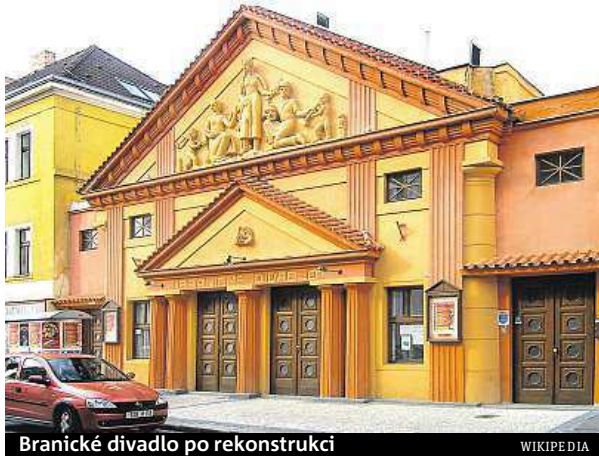
Branické divadlo po rekonstrukci