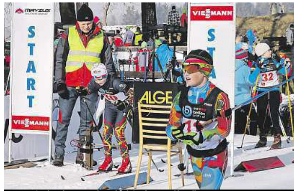
Start jednoho ze závodů biatlonového žactva

V březnu se zraky fanoušků přesunou na MS do Osla, podobně jako dětí z Roveru. „Pokud se potkáme na akci, tak většinou děti chtějí, abychom si biatlon pustili. Stejně tomu bude i nyní,“ dodává Novák. PAVEL URBAN