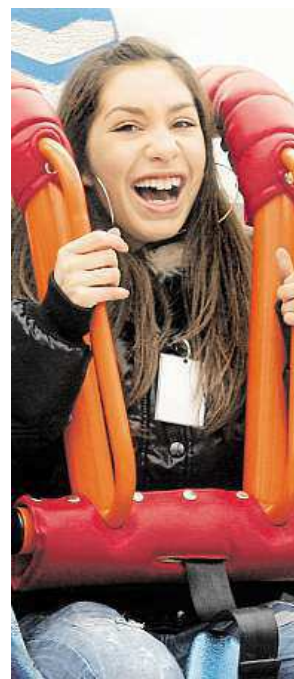
Horská dráha, autíčka, volný pád z devadesáti metrů – oblíbené atrakce