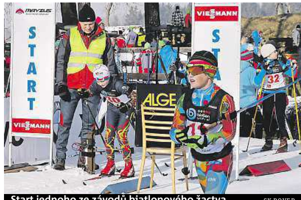
Start jednoho ze závodů biatlonového žactva

V březnu se zraky fanoušků přesunou na MS do Osla, podobně jako dětí z Roveru. „Pokud se potkáme na akci, tak většinou děti chtějí, abychom si biatlon pustili. Stejně tomu bude i nyní,“ dodává Novák. PAVEL URBAN