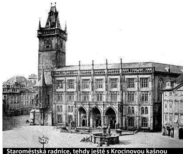
Staroměstská radnice, tehdy ještě s Krocínovou kašnou