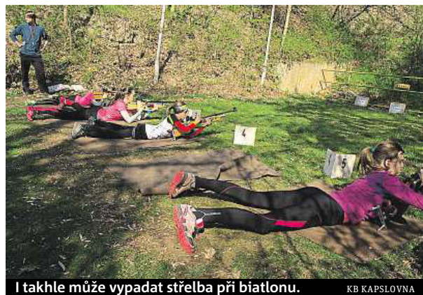
I takhle může vypadat střelba při biatlonu.