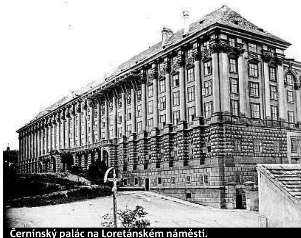
Černínský palác na Loretánském náměstí.