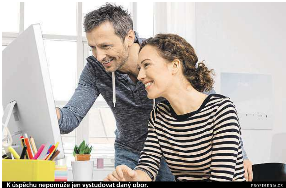
K úspěchu nepomůže jen vystudovat daný obor.

Do průzkumu se zapojilo také třicet personalistů. Prakticky za samozřejmost u uchazečů o vysokoškolské pozice považují praxi v oboru během studia a zahraniční pracovní nebo studijní pobyt. „Následující aktivity, které jsou spojeny s komunikativností, organizačními schopnostmi nebo smyslem pro týmovou práci," doplnil Schmid. Patří mezi ně například aktivní členství ve studentských spolcích a organizacích. čtk