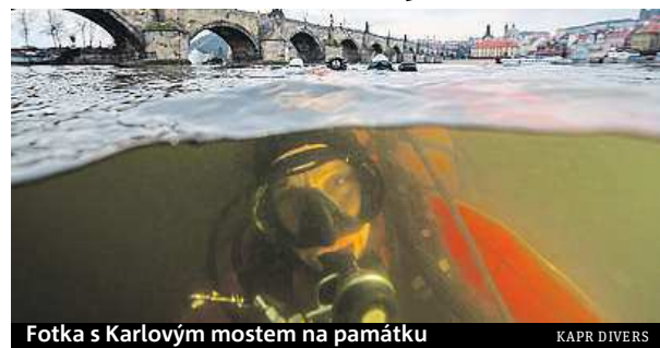
Fotka s Karlovým mostem na památku

Na zimu spojenou s výzkumem jsou ale potápěči podle Slezáka připraveni. „Když se několik hodin koupete ve studené vodě, tak vám teplo není, ale už jsme na to zvyklí,“ vysvětluje potápěč. Na chlad se podle něj dá dobře připravit dobrým vybavením. ROBERT OPPELT