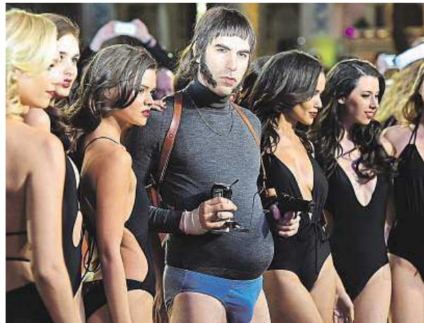
Sacha Baron Cohen v nové roli fotbalového blázna

Nobby žije v severoanglickém městě Grimsby. Má devět dětí a atraktivní přítelkyni. Celý život pátrá po svém mladším bratru Sebastianovi, od kterého byl odloučen v dět-