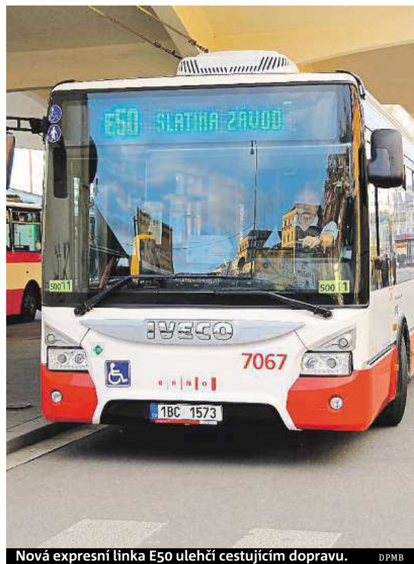
Nová expresní linka E50 ulehčí cestujícím dopravu.

Obsazenost autobusů je v průměru okolo šedesáti procent. Nejvytíženější bývá první spoj, který z Kamech na Černovickou terasu odjíždí v pět hodin ráno. Od ledna proto dopravní podnik na tento čas nasadil kloubový autobus s větší kapacitou. Do budoucna by v Brně mohly při-