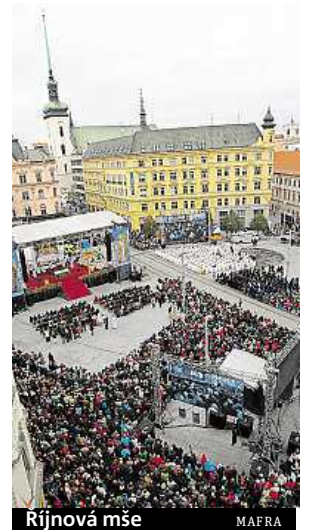
Ríjnová mše MAFRA

rozšíření sortimentu,“ doplnila Flamiková.