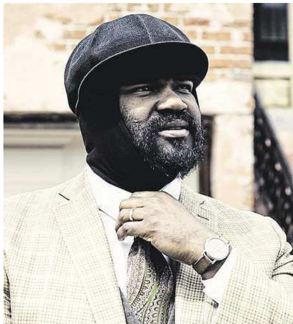
Zpěvák Gregory Porter už se těší do Brna.

Porter doposud nahrál tři alba a každé mu vyneslo pozvánku na udílení cen Grammy. První dvě desky nazvané Water a Be Good získaly nominaci, za třetí album Liquid