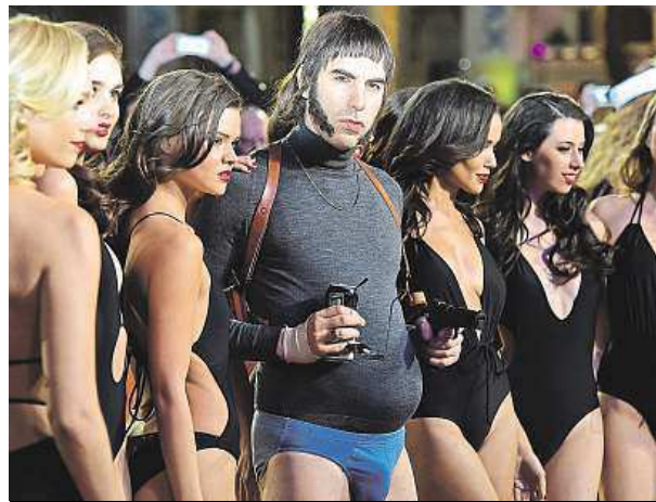
Sacha Baron Cohen v nové roli fotbalového blázna

Nobby žije v severoanglickém městě Grimsby. Má devět dětí a atraktivní přítelkyni. Celý život pátrá po svém mladším bratru Sebastianovi, od kterého byl odloučen v dět-