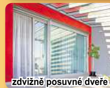
zdvíženě posuvné dveře