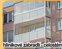
hliníkové zábradlí - celostěny