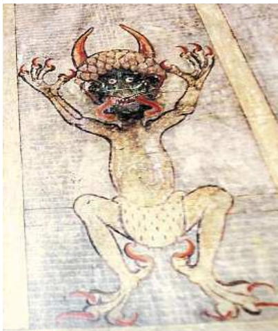
V Brně si můžete prohlédnout ďábla. Na snímku vpravo je průvodkyně Kristýna Havlová.

Rukopis měřící téměř metr na výšku a přes půl metru na šířku vznikl někdy mezi lety 1200 až 1230. Odborníci na něm obdivují především skutečnost, že prakticky celé dílo o 640 stranách podle všeho vytvořil jediný člověk, který zřejmě pracoval v zaniklém benediktinském klášteře v Podlažicích na Chrudim-