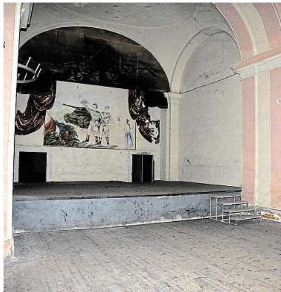
Tady se bude hrát divadlo, promítat filmy, pít káva.

Sanace potrvá několik měsíců, další dva roky by měl areál sloužit pro workshopy, příležitostné výstavy, divadelní představení a jiné kulturní a kreativní akce. Pro další vývoj projektu bude klíčové, zda a za jakých podmínek se na něj podaří získat evropské dotace. RADEK BABIČKA