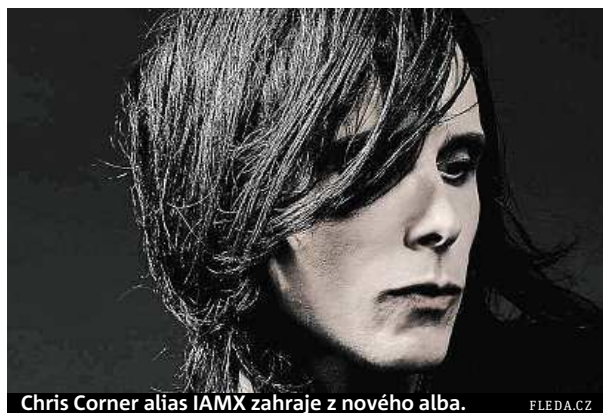
Chris Corner alias IAMX zahraje z nového alba.