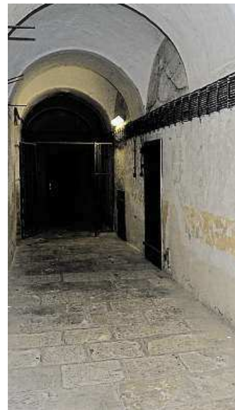
ARCHIV BRNĚNSKÉHO MAGISTRÁTU