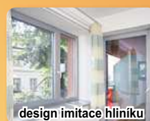
design imitace hliníku