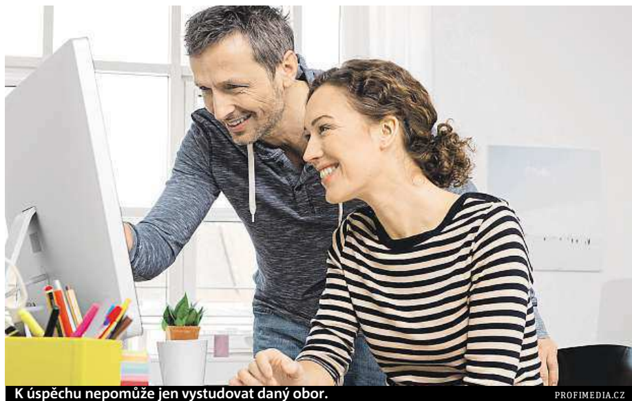
K úspěchu nepomůže jen vystudovat daný obor.

obtížná rodinná situace nebo nutnost vyrovnat se s jinakostí. Do průzkumu se zapojilo také třicet personalistů. Prakticky za samozřejmost u uchazečů o vysokoškolské pozice považují praxi v oboru během studia a zahraniční pracovní nebo studijní pobyt. „Následují aktivity, které