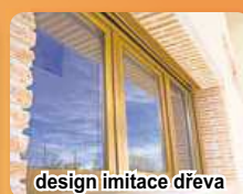
design imitace dřeva