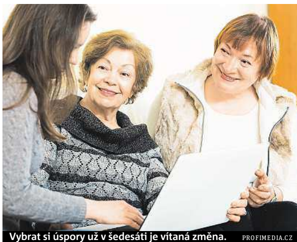
Vybrat si úspory už v šedesáti je vítaná změna.

Vítaná změna je také možnost vybrat si nasporené peníze už v 60 letech. Není tak nutné čekat na chvíli, kdy získáte nárok na výplatu státního důchodu. Navíc je možné si peníze nechat vyplácet jako penzi (musí to být aspoň na deset let), která je pak osvobozena od zdanění výnosů.