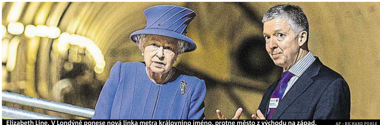
Elizabeth Line. V Londýně ponese nová linka metra královnino jméno, protne město z východu na západ.

Důchod. Rodiče či prarodiče na něj nyní mohou spořit i dětem do osmnácti let. Peníze dřív. K naspořeným financím se senioři dostanou už v šedesáti letech, nebude tedy nutné čekat na odchod do důchodu STRANA 3