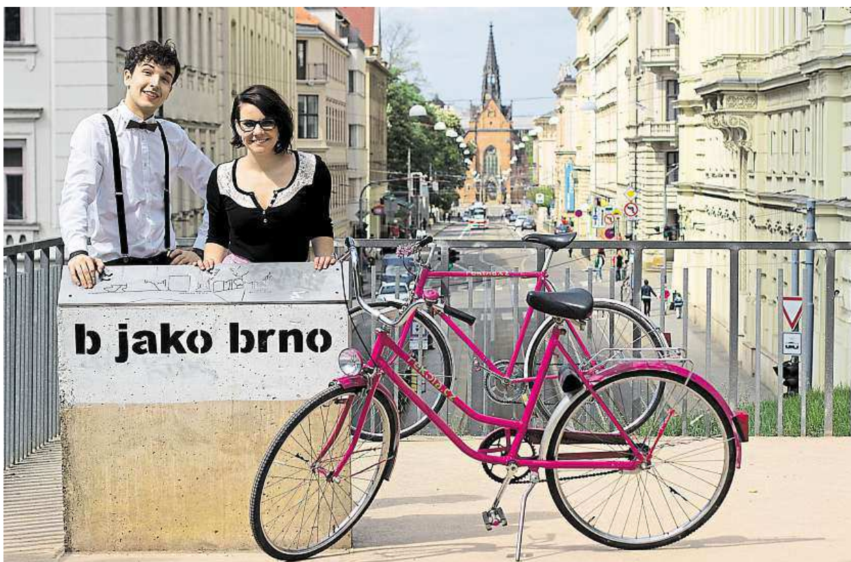
Od jara budou moci růžová kola na cestování po městě využívat i Brňáci.

Tolik bude činit roční poplatek za využívání kol.