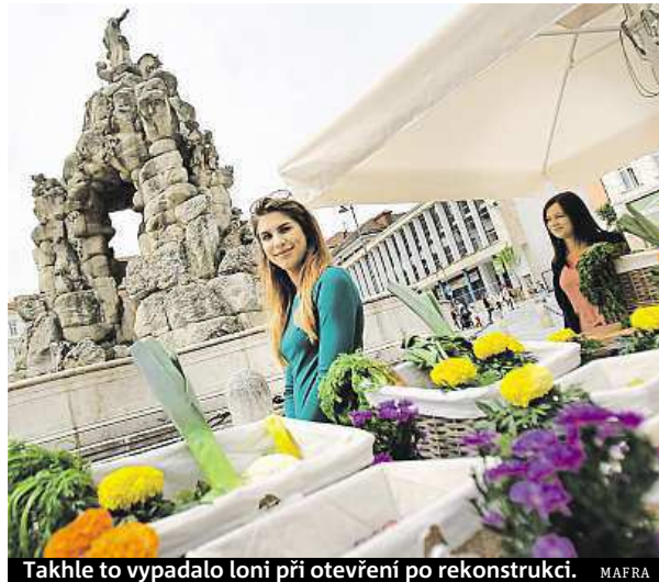
Takhle to vypadalo loni při otevření po rekonstrukci.

Dále dostali přednost ti, kteří nabízejí zajímavý sortiment, a zájemci, kteří chtějí prodávat dlouhodobě. „Novinkou této sezony je totiž