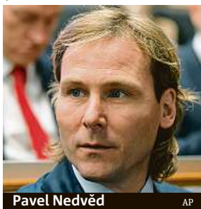
Pavel Nedvěd