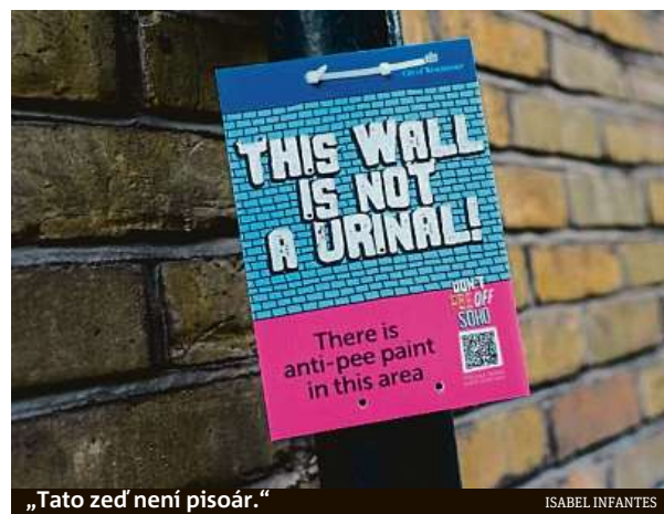
„Tato zeď není pisoár.“

Městská rada se inspirovala zkušenostmi z jiných měst, zejména v Německu. Vybrala deset fasád, kde náter použila. Kolemjdoucí va-