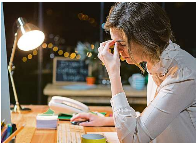
Dlouhodobý stres negativně ovlivňuje naše zdraví.

UPOZORNĚNÍ: rozhodující je pořadí přihlášek!