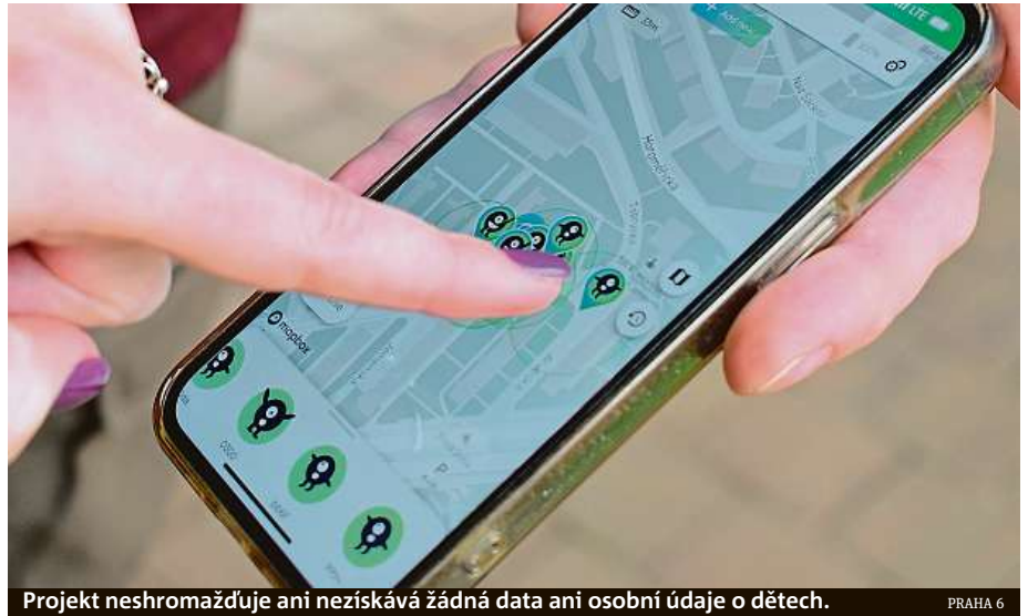
Projekt neshromažďuje ani nezískává žádná data ani osobní údaje o dětech.