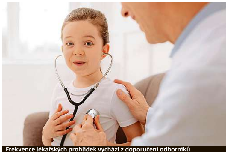
Frekvence lékařských prohlídek vychází z doporučení odborníků.

„V dospělém věku nechodí k lékařům zejména mladší lidé, kteří se cítí zcela zdraví, někdy je důvodem i nedůvěra, preference samoléčby podle doporučení známých či internetu, nedostatek času a někdy paradoxně i obava, „aby mi něco nenašli“, vysvětluje praktická lékařka Jana Uhrová. „A určitá skupina občanů své zdraví zanedbává úmyslně,“ poukazuje na nešvar Uhrová.