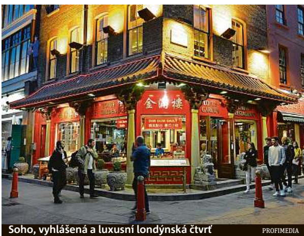
Soho, vyhlášená a luxusní londýnská čtvrť

Ve čtvrti Soho je na 400 barů, restaurací a diva-