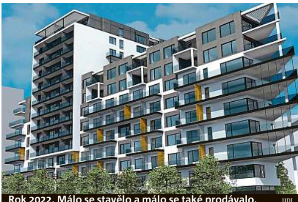
Rok 2022. Málo se stavělo a málo se také prodávalo. UDI

Ceny lámaly rekordy. Investice do nemovitostí se jevily jako nevyčerpatelný zlatý důl.