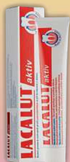
Lacalut aktiv zubní pasta 75 ml