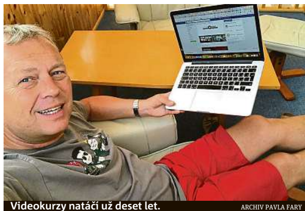
Video kurzy natáčí už deset let.

Při rozhodování, které kurzy natočit, se díváme na potenciál zaujmout lidi a obohatit je. Výsledná odezva je někdy také překvapením. Například jsme si nebyli jistí tématy obličejové masáže nebo masáže miminek, ale nakonec jsou velmi úspěšné. Mezi top