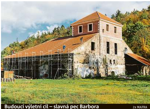
Budoucí výletní cíl – slavná pec Barbora

Po zprovoznění se má pec stát jedním z klenotů nejen Podbrdská, ale také rozsáhlejší oblasti Geopark Barrandienu. Barbora by navíc měla patřit k hlavním zastávkám na sedmnáctikilometrové