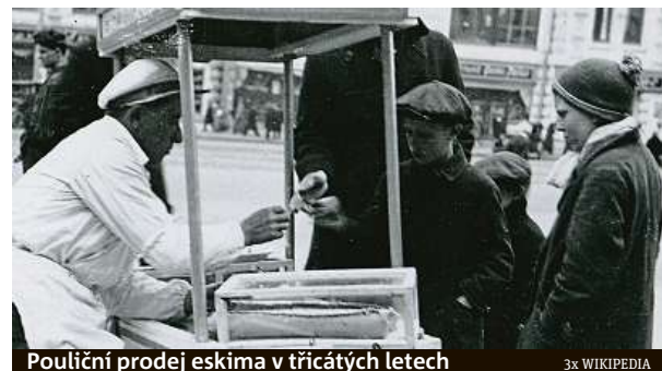
Pouliční prodej eskima v třicátých letech