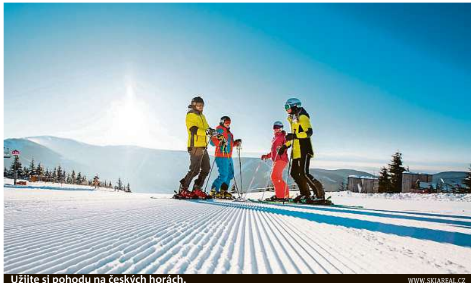
Užijte si pohodu na českých horách.