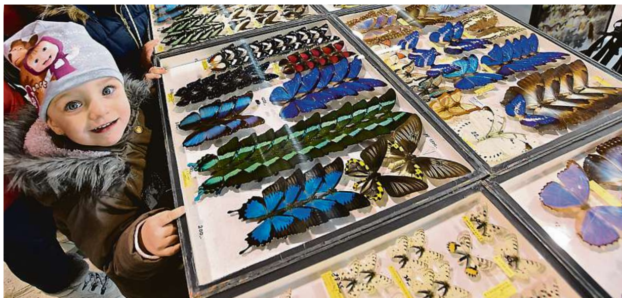
Na kroměřížském výstavišti se v sobotu konal entomologický výměnný den spojený s prodejní výstavou.

80 000. Tolik nakažených denně můžeme očekávat kolem středy, řekl ministr Válek. Starší lidé. Epidemie se začne přesouvat do seniorské populace. Až 400 tisíc. Tolik lidí nad šedesát nemá vůbec očkování STRANA 2