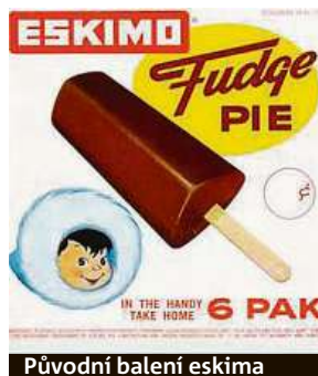
Původní balení eskima