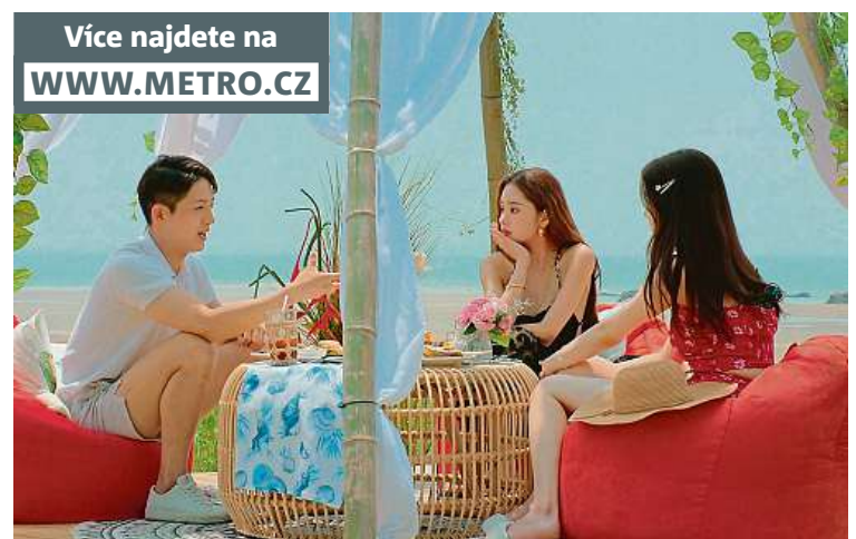
Nejen Hra na oliheň. Filmaři z Jižní Koreje přicházejí s další peckou. NETFLIX

Už jste stihli zkouknout všech osm dílů seznamovací reality show Peklo pro nezadané, která měla na Netflixu premiéru kolem Vánoc? Pokud ne, tak to koukejte napravit. Nejde totiž jen o to, že se v tomhle odpočinkovém pořadu dvanáct atleticky vyhlížejících mužů a žen snaží uniknout z opuštěného ostrova tím, že vytvoří páry. Podobný koncept diváci už viděli jinde a jindy. Jihokorejci jsou ale svérázkové. A v tom tkví i kouzlo téhle vztahovky. „Až po zhlédnutí novinky s názvem Peklo pro nezadané jsem se přesvědčil o tom, že koukat na podobný typ pořadu nemusí nutně zname-