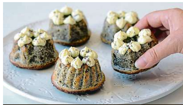
Cuketové minibábovky s mákem

Na šest minibábovek potřebujeme - těsto: 200 g oloupané cukety, 2 vejce,