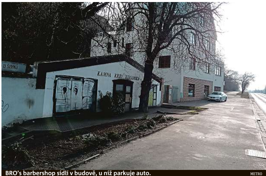
BRO's barbershop sídlí v budově, u níž parkuje auto.

Holičství sídlí v prostorách zmíněného obchodního centra na neobvyklém místě i proto, že v nákupní pasáži kolem něj prochází lidé z obou stran. Podle zjištění deníku Metro ale přineslo unikátní místo také unikátní problém. Místní holiči se tu musí při práci obejít bez přívodu vody. Ta sem podle zástupců holičství, se kterými jsem dříve komunikoval, sice zavedena je, ale co chybí, je kanalizace. Na problém deník Metro upozorňoval před dvěma a půl rokem. Dnes nedošlo k nápravě. „Ho-