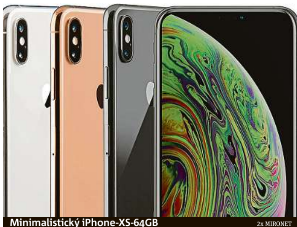
Minimalistický iPhone XS 64GB

iPhone je zkrátka zařízení, kterému uživatelé věří a mají pro to ty nejlepší důvody. Překážkou v jejich pořízení ale občas bývá vyšší cena. A právě tuto překážku nyní odboural internetový obchod Mironet, který v rámci lednového výprodeje zlevnil jeden z neoblíbenějších modelů iPhone XS o rovných 20 procent.