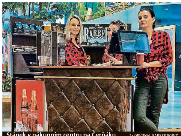
Stánek v nákupním centru na Černáku 2x ORIGINAL BARBER POINT