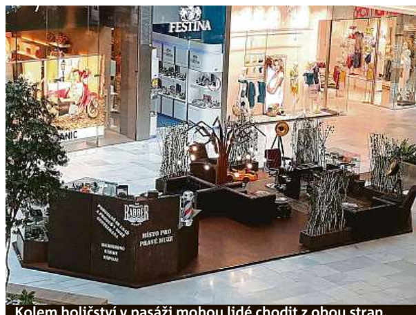
Kolem holičství v pasáži mohou lidé chodit z obou stran.