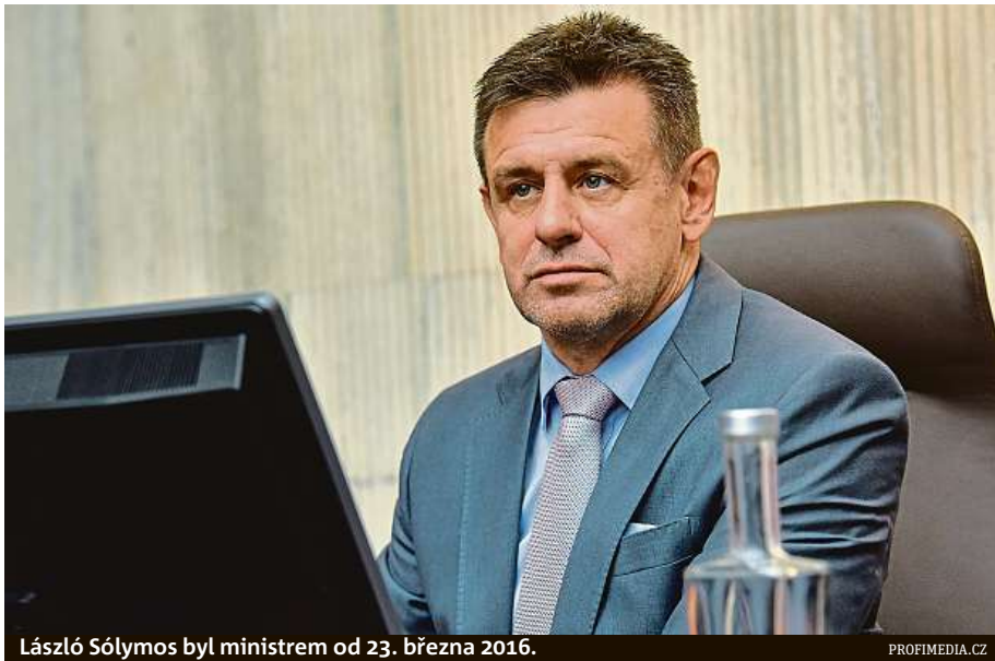
László Sólymos byl ministrem od 23. března 2016.

Podle listu Sme se ministr a jeho bratr pohádali s personálem restaurace a poté, co z ní byli vykážani, ministrův bratr kopl do prosklených dveří a rozbil je. Když na místo dorazila policie, Sólymos