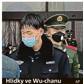
Hlídky ve Wu-chanu

Čínské ministerstvo dopravy včera vyzvalo dopravce,