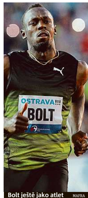
Bolt ještě jako atlet

„Byla to zábava. Neříkám, že bylo něco špatně, ale asi jsme na to měli jít jinak. Životem se člověk učí. Byla to dobrá zkušenost. Užil jsem si být součástí týmu,“ řekl Bolt jamajské televizi. „Teď budu dělat spoustu jiných věcí.“