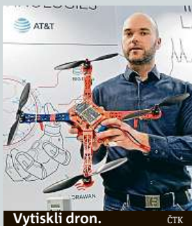
Vytiskli dron. ČTK

Na brněnské Fakultě elektrotechniky a komunikačních technologií Vysokého učení technického otevřeli laboratoř, která se zaměřuje na moderní komunikaci. Mají tam 3D tiskárnu, která umí vyrobit i dron. Inovační laboratoř budou primárně využívat studenti telekomunikačních a informačních systémů a informační bezpečnosti. ČTK