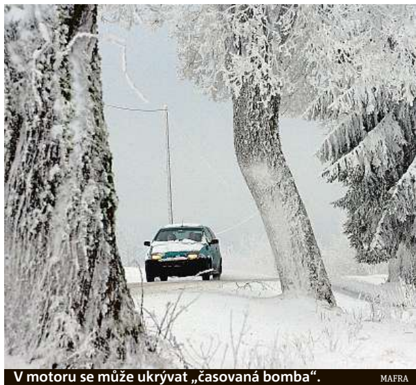
V motoru se může ukrývat „časovaná bomba“.

Chladičí kapalina plní řadu funkcí. První a nejdůležitější je její schopnost nezamrznout. Tuto vlastnost chladičí