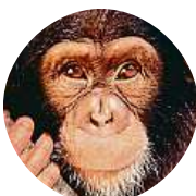
Patrik Pseudofilosof Ne. Podával bych horší výkony. Navíc je to nezodpovědné.