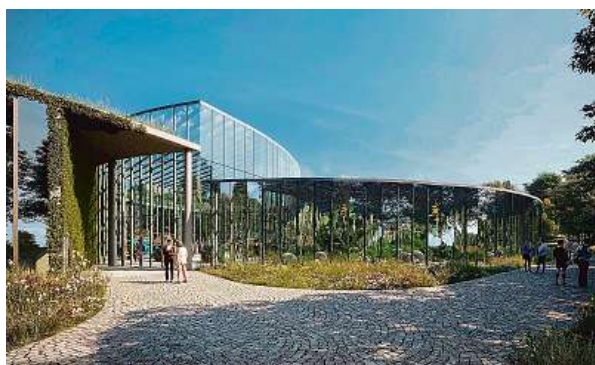
Vizualizace vstupního areálu Sever BOTANICKÁ ZAHRADA HL. M. PRAHY

Probíhá například dostavba areálu obklopujícího skleník Fata Morgana. Zde