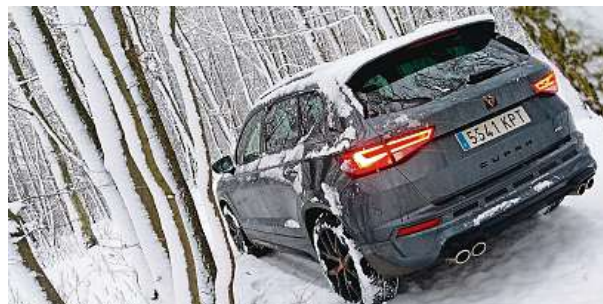
Každý znalec se otočí.