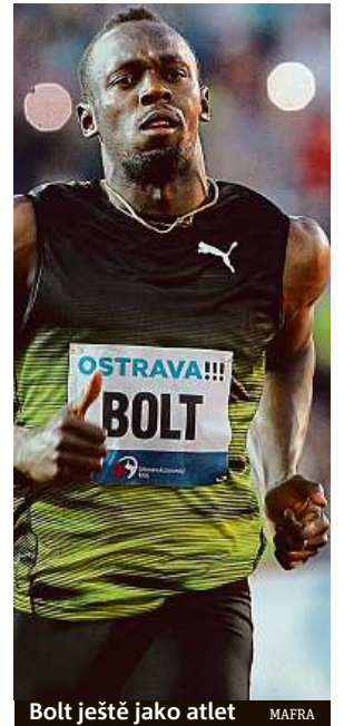
Bolt ještě jako atlet

„Byla to zábava. Neříkám, že bylo něco špatně, ale asi jsme na to měli jít jinak. Životem se člověk učí. Byla to dobrá zkušenost. Užil jsem si být součástí týmu,“ řekl Bolt jamajské televizi. „Teď budu dělat spoustu jiných věcí.“