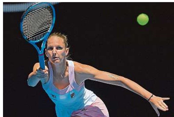
Karolína Plíšková si na Serenu Williamsovou věřila.

Set a půl Plíšková proti Williamsově výborně podávala a po brejku v páté hře druhé sady mířila za výhrou. Sedminásobná vítězka Australian Open ale přidala a vyrovnala na 1:1 na sety. V rozhodující sadě Plíšková prohrávala už 1:5 a při podání Američanky če-