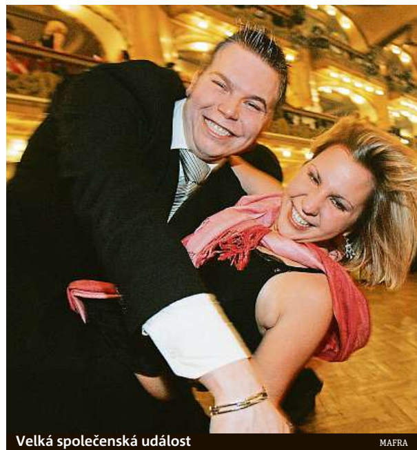
Velká společenská událost

Za podobnou cenu jako v Lucerně je možné si v Praze pronajmout například sál v Národním domě na Vinohradech, zatímco mimopražští studenti zaplatí až o několik desítek tisíc méně. Třeba pronájem Dělnického domu Jihlava přijde na 50 tisíc korun, Dům kultury města Ostravy začíná již na částce 20 tisíc. ANNA PORTEŠOVÁ