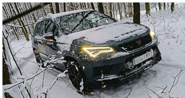
Přední otvory skutečně přivádějí vzduch k brzdám.