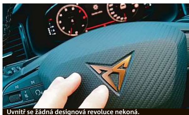
Uvnitř se žádná designová revoluce nekoná.