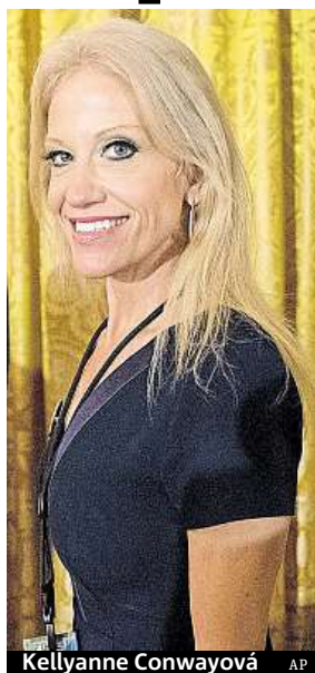
Kellyanne Conwayová AP

Podle amerických médií poslal Spicera za novináři Trump s úkolem říci jim, jak to bylo s účastí na inauguraci. Komentátor The Daily Beast Dean Obeidallah se pobavil tím, že Trumpův tým, který hlasitě brojil proti politické korektnosti, nyní trvá na korektním popisu lži. „Pardon, tak jak to řekl Chuck Todd, alternativní fakta nejsou fakta, ale lži,“ uvedl Obeidallah. Agentura AP připomenula, že Trumpův mluvčí také mylně tvrdil, že washingtonské metro v pátek zaznamenalo více cestujících než v době Obamovy inaugurace, přičemž objektivní údaje jsou 728 tisíc pasažerů v roce 2013 a 570 557 v den Trumpovy inaugurace. ČTK