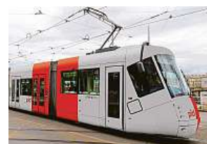
Nová podoba tramvaje...