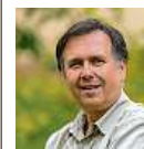
Petr Hamerník Zoo Praha

ka, mrkev), které jim bude předáno v následujících dnech.